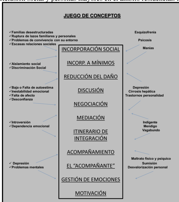
Cuadro 6. Exclusión social y personas mayores en el ámbito residencial: la Intervención