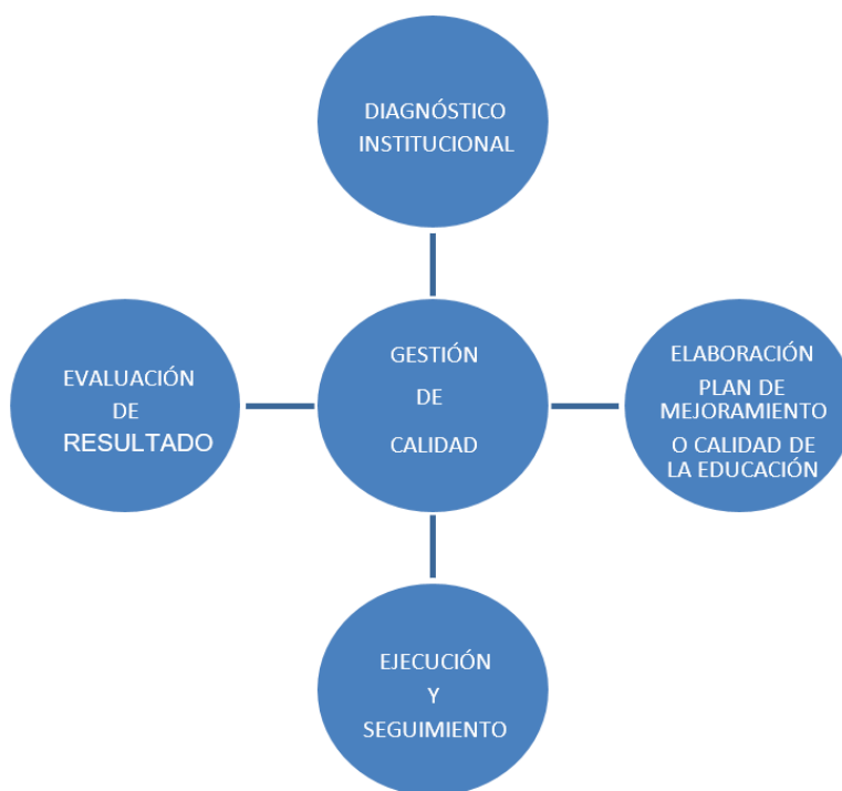
Figura 2. Gestión de Calidad Nota: Elaboración propia, 2015.

En el centro educativo se deben establecer cuatro fases para garantizar una gestión de calidad.