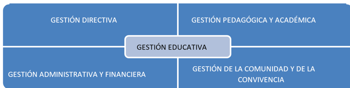
Figura 1. Gestión educativa

Los centros educativos se han transformado, pasando de instituciones de conceptos y políticas cerradas e individualistas, a sistemas más amplios y estructurados, lo que requiere de una gestión educativa cuya planificación demanda un mayor compromiso con nuevas formas de gestión que permitan el cumplimiento de las nuevas estructuras organizacionales, capaces del desarrollo de potencialidades e igualdades en el sistema educativo, dividida en cuatro ámbitos, a saber: gestión directiva; gestión pedagógica y académica; gestión administrativa y financiera; y gestión de la comunidad.