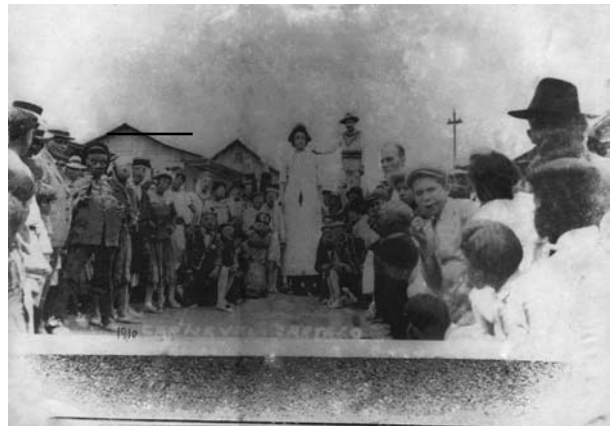
Carnaval en Cartago, 1910.