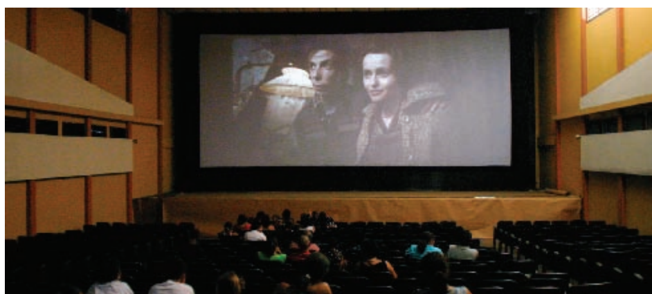
Cine Hong Kong, ciudad de Limón.