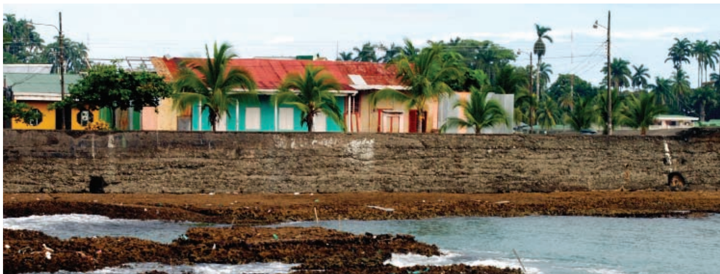
← El tajamar...