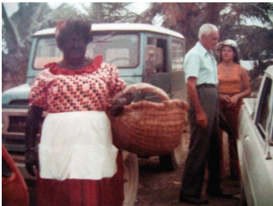
▲ Mi abuelo Lolo...

Relatos recogidos y transcritos por Gabriela Hernández.