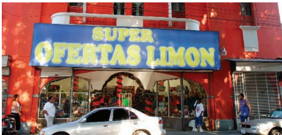
▲ Este era el teatro Acón, hoy es un almacén de ofertas...

Es una provincia excepcional en el nivel nacional, lo que pasa es que aquí estamos como sin pasado, sin historia, cuando es la provincia más rica.