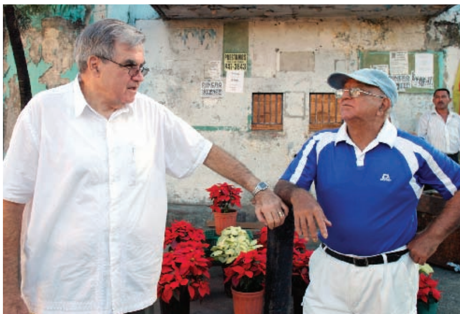
► ...aquí en Limón existía una tertulia y era una tertulia que hacíamos todos los días en las esquinas de las calles.