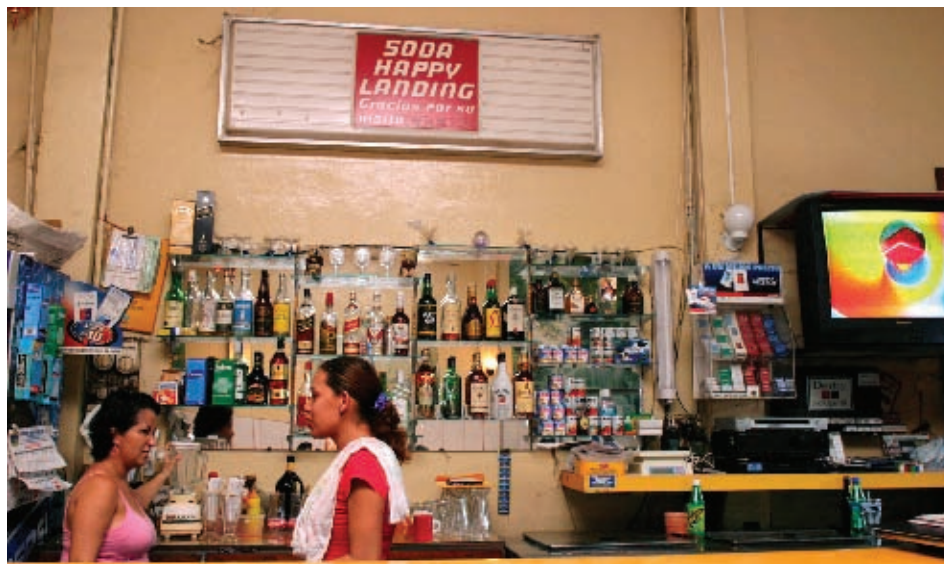
▼ Soda Happy Landing

en la calle. Ahí mismo después del cine es bonito, a la salida, los comentarios, si es una película, si es una actividad artística, lo que sea.