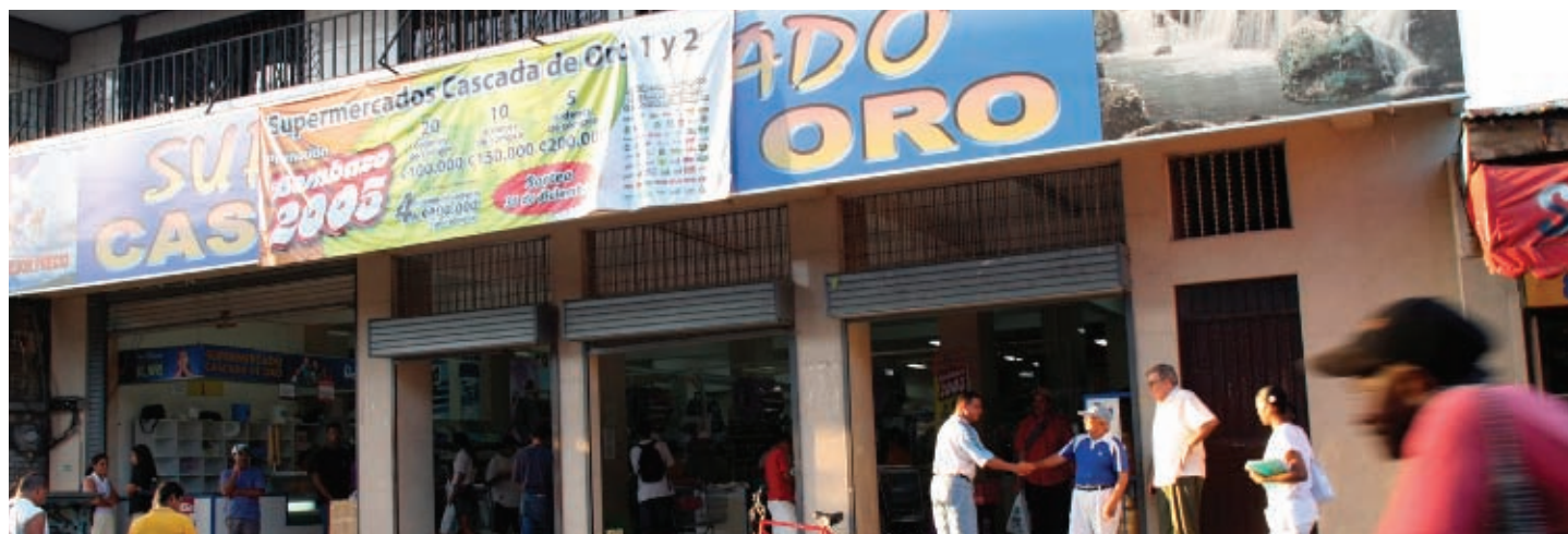
▲ Aquí se encontraba el cine Arrasty.