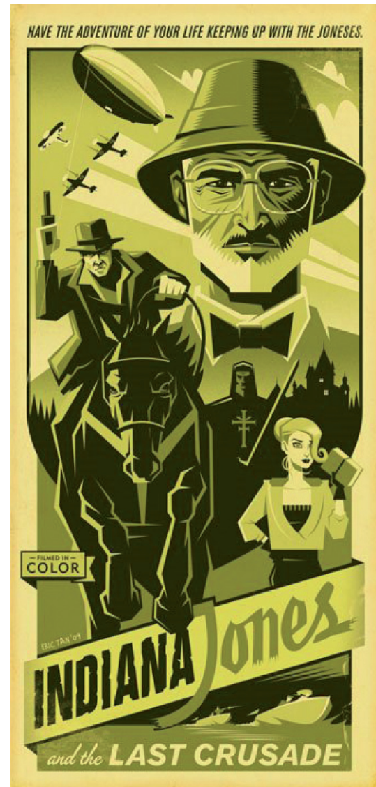
Fig. 5: La última cruzada.

Muchas veces la voluntad política no está del lado de la protección patrimonial. Aunque Indy le quita la cruz de Coronado a los huaqueros, inicia una persecución que culmina con la llegada de él a su casa. La autoridad del pueblo lo obliga a devolver el bien a los saqueadores,