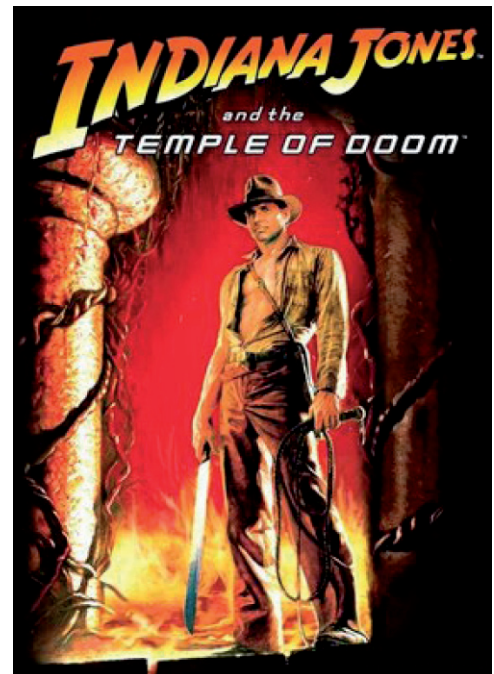
Fig. 4: El templo de la perdición.

Como parte del culto a la diosa Kali, se observa la extracción del corazón de una persona aún viva. Debemos aclarar que el culto thuggee no involucraba este tipo de prácticas; más bien, los thugs son conocidos por estrangular a sus víctimas. En cambio, varias sociedades antiguas de América (e.g. mayas, muiscas, mexicas, toltecas, entre otras), sí practicaban sacrificios humanos con la extracción de corazones. El lector puede notar la tergiversación de datos y mezcla de costumbres de culturas distintas, muy separadas en tiempo y en espacio.