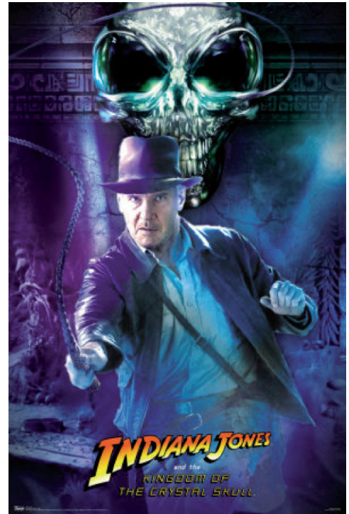
Fig. 6: El reino de la calavera de cristal.

Para cerrar con broche de oro, entra a una habitación llena de objetos procedentes de diferentes épocas y culturas (e.g. sumeria, babilónica, egipcia, china, macedonia, etrusca, romana, entre otras), los contempla y reflexiona: "coleccionistas... ¡eran arqueólogos!" (minuto 101). No, en definitiva los arqueólogos no somos coleccionistas. Indiana Jones concluye esto porque él mismo no es un arqueólogo, es un héroe de ficción que se dedica a saquear y con una idea difusa de lo que es la Arqueología.