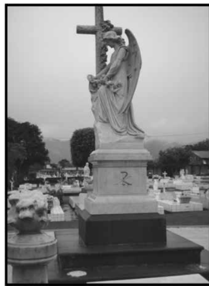
Sepulcro perteneciente a la familia Rojas. Losa con escultura. Los ángeles pueden estar orando ante la cruz, pero invariablemente portan flores que constituyen una ofrenda perenne.

Mas en el monumento funerario de la familia Mata Bonilla 44 , de muy buena factura y de gran belleza plástica, la figura del ángel —con las alas abiertas y extendidas, como si el vuelo nunca se hubiese detenido— se apresura a consolar a la doliente, representada como una joven adolescente de largos cabellos y vestida con túnica de pliegues ligeros y evanescentes, quien, como certeza del estado espiritual después de la muerte, está recostada a los pies de una gran cruz en forma latina. Ambas figuras están labradas y talladas en mármol blanco, son de tamaño natural y forman una unidad temática que quizá implica, además, el dolor confortado por la fe. Los rostros son clásicos y simétricos, lo mismo que el peinado.