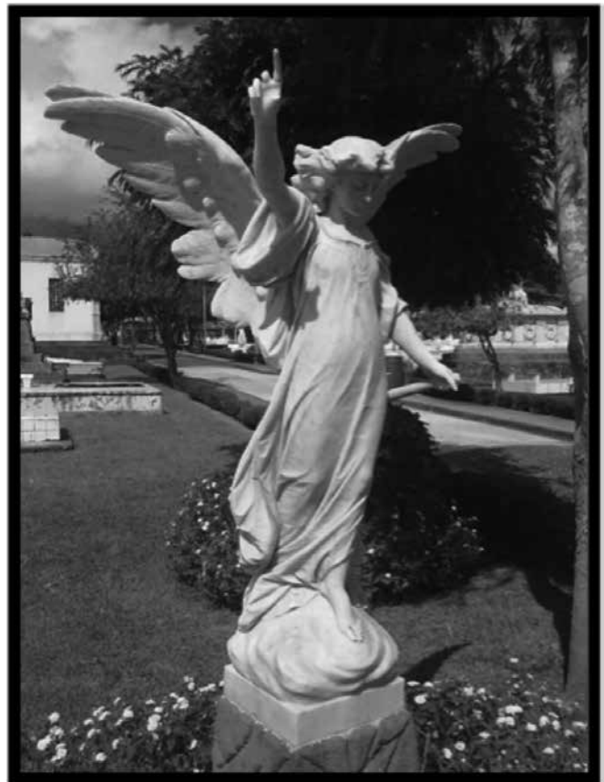
Ángel con el traje talar y los brazos descubiertos. Las alas están abiertas en signo de triunfo. Con la mano izquierda señala hacia lo alto, lo que implica el deseo de inspirar consuelo a los dolientes.

Las representaciones escultóricas de ángeles en los monumentos funerarios del Cementerio General de Cartago se personifican con diferentes atributos y, por consiguiente, con diferentes simbolismos. Algunos ángeles esperan al afortunado con los símbolos del triunfo: coronas de laureles y hojas de palma o palmera, indicando como la fe verdadera puede sobre la muerte y el pecado. Otros se llevan el dedo a los labios, custodian y demandan silencio. No faltan los que en recia actitud (gesto, manos) guardan el sueño eterno de los difuntos, o se dedican a servir de compañía a los deudos compartiendo sus penas. Otros parecen meditar, o alargan su mano en ayuda del alma en su ascenso a los cielos. Todo un coro celestial destinado a facilitar el tránsito entre la vida y la muerte. La totalidad de ellos se plasman como jóvenes, con lo que se evoca la renovación constante de la función para la cual fueron colocados.