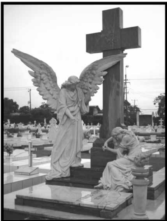
Tumba de la familia Mata Bonilla. Losa con esculturas. El ángel reconforta a la doliente postrada al pie de la cruz porque es un anhelo de los cristianos abrazar a Dios cuando lleguen al cielo. El rostro del ángel muestra confianza, mientras que la doliente se sume en la tristeza, mas no en la desesperación.