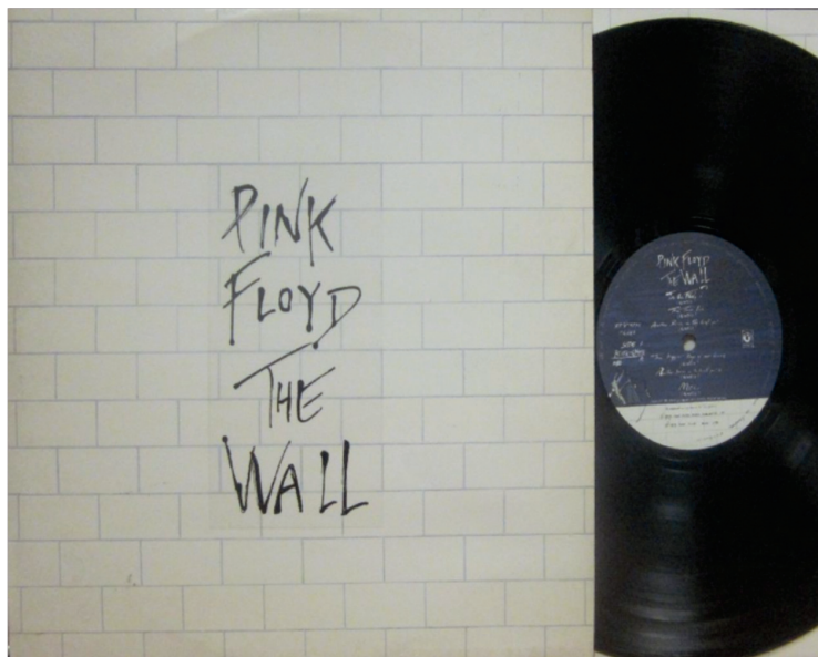
Portada del disco The Wall .

la segunda guerra mundial, una madre sobreprotectora, una educación severa y deshumanizante, y relaciones amorosas fallidas. Waters afirma que muchos de estos factores fueron basados en acontecimientos de su vida y de sus allegados, entre ellos Syd Barrett. (ibíd.).