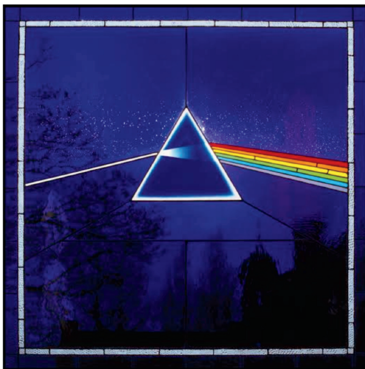
Portada del disco The dark side of the moon .

"Have a cigar" representa solo uno de los muchos temas críticos y trascendentales que hacen universal la obra de Floyd. Tal vez por ser británicos o por sus matices intelectuales fueron significativamente metódicos y organizados a la hora de presentar su obra. De este modo, la banda en sus diferentes álbumes explora diferentes temáticas. En el caso de The dark side of the moon , la banda quiso plasmar la vida en un mundo moderno, donde la intolerancia, la avaricia y la deshumanización constituyen los hilos que entretrejen las relaciones entre las personas, su ambiente y ellos mismos.