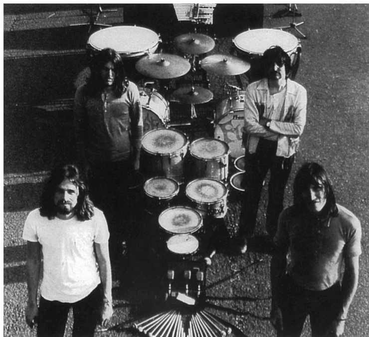
Pink Floyd. En sus inicios.

¿Pero cuál la relación entre el cultivo de mis habilidades mentales y el volver, tal cual hijo pródigo, a mi cuna musical, Floyd? Considero que la respuesta de esta interrogante yace en el valor de la creación de la banda, no solo en el nivel musical, sino también temático y cultural.