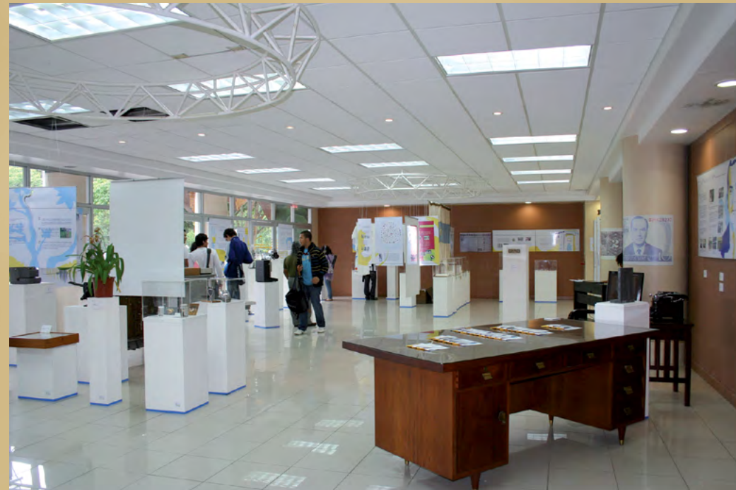
Foto 7. Exposición "Universidad de Costa Rica: 70 años, 70 historias", en la Sala Multiusos de la Escuela de Estudios Generales (25 de mayo al 25 de junio del 2010). Esta exposición fue curada y diseñada por el museo+UCR.

Todos estos museos, instancias y colecciones son parte de la infraestructura que el Alma máter tiene para el beneficio de la comunidad universitaria y —en general— del país. La gran cantidad de artefactos y especímenes bajo su custodia son una clara representación de la herencia cultural y natural de Costa Rica.