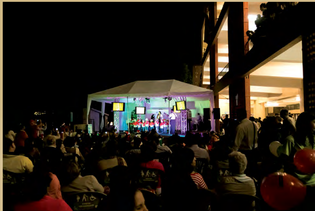
Foto 15. Velada navideña 2014 del museo+UCR, en el Pretil de la Escuela de Estudios Generales.