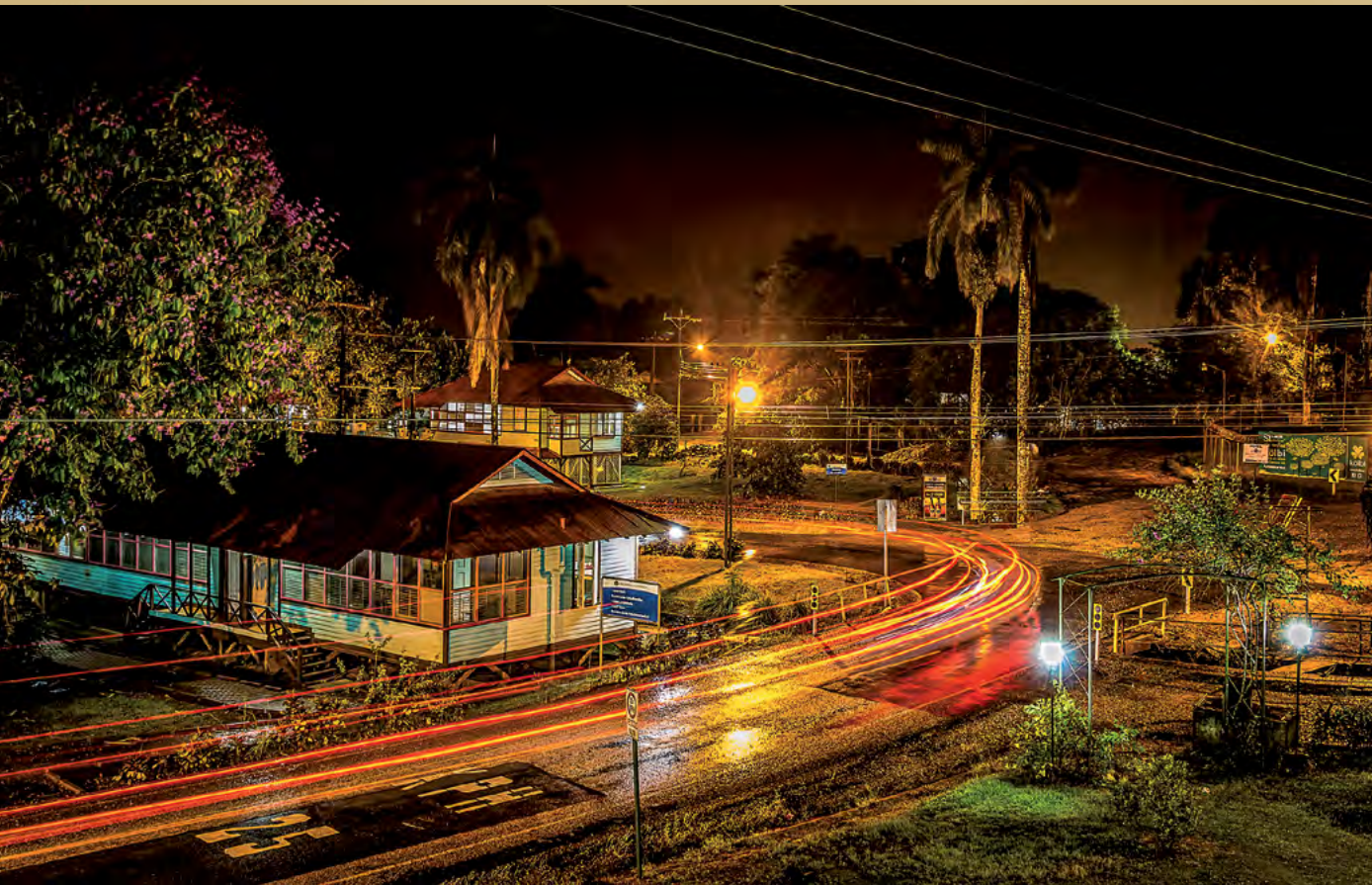
Foto 16. Edificios patrimoniales del Recinto de Golfito de la Universidad de Costa Rica. Forman parte de las colecciones de la Institución.

pueblo creador, impulsor de una conciencia sobre la convivencia con la naturaleza, su conservación y su significado, y propulsor del diálogo entre individuos de diferentes edades, niveles escolares, disciplinas y formas disímiles de ver y vivir el mundo. El museo+UCR ya no es un sueño, es una realidad en concreto.