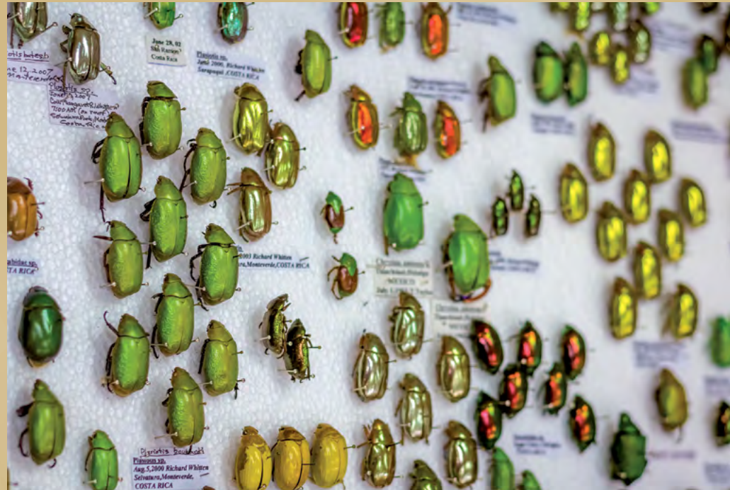
Foto 5. Exposición “Artrópodos espectaculares: la Colección Whitten” en la Sala Multiusos de la Escuela de Estudios Generales (23 de octubre al 23 de noviembre del 2013) Colección Whitten de la Escuela de Biología.

“El Museo de la Universidad de Costa Rica ( museo+UCR ) es una institución permanente, sin fines de lucro, al servicio de la sociedad y de su desarrollo, abierta a la comunidad universitaria y al público, en general, que adquiere, conserva, investiga, difunde y exhibe el patrimonio natural y cultural, tangible e intangible de la humanidad, particularmente de la región centroamericana con fines educativos y de entretenimiento. Su misión es servir de apoyo a la Universidad de Costa Rica en