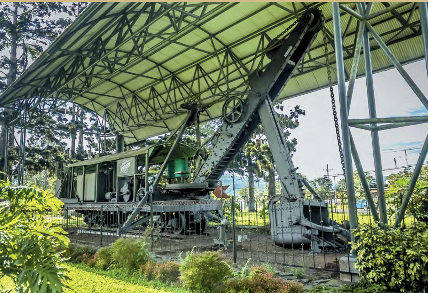
Foto 10. Pala de vapor en la Sede del Atlántico. Utilizada para las excavaciones del Canal de Panamá y traída a Costa Rica en 1920 para limpiar los constantes deslizamientos de la vía férrea a Limón.

La existencia del museo+UCR es de gran interés para la comunidad universitaria y nacional. Ya lo demuestra el "Análisis del interés y de las expectativas de la comunidad nacional hacia un posible museo universitario", preparado por el M.Sc. Marco Fournier Facio del Instituto de Investigaciones Sociales en el 2003, (IIS, 2003) en el que una gran mayoría de los encuestados se mostró positiva a su creación. Además, un 82,6% consideró a los museos muy instructivos. En pocas palabras, ha existido un clima favorable para contar con un museo universitario, lo cual se suma al prestigio que tiene la Universidad de Costa Rica en la población costarricense. Indudablemente, el museo+UCR contribuirá a sustentarlo.