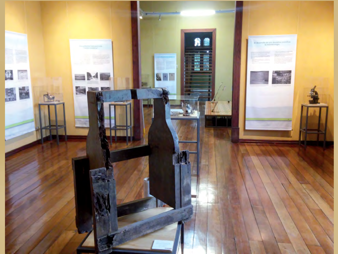
Foto 4. Exposición "Sanatorio Dr. Carlos Durán Cartín: una comunidad entre montañas" En el Museo Municipal de Cartago (julio-agosto 2015). Curada y diseñada por el museo+UCR.