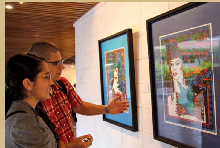
Foto 9. Exposición "Jardines Interiores. Obra gráfica de Rafael Cuevas Molina", en la Escuela de Artes Plásticas (13 de mayo al 2 de junio del 2014). En el marco del 20 aniversario del CIICLA, el museo+UCR colaboró en la curaduría y diseños de esta exhibición.

A pesar de lo anterior, en el 2000, se detectó un desconocimiento y falta de identificación y vinculación de la comunidad universitaria y la sociedad, en general, con el quehacer de las colecciones; una incipiente estructura organizativa, que limitaba la integración de las colecciones; ausencia de una política institucional y de normativas para preservarlas; y espacios limitados para el almacenamiento de las colecciones y, por ende, condiciones inadecuadas para su preservación.