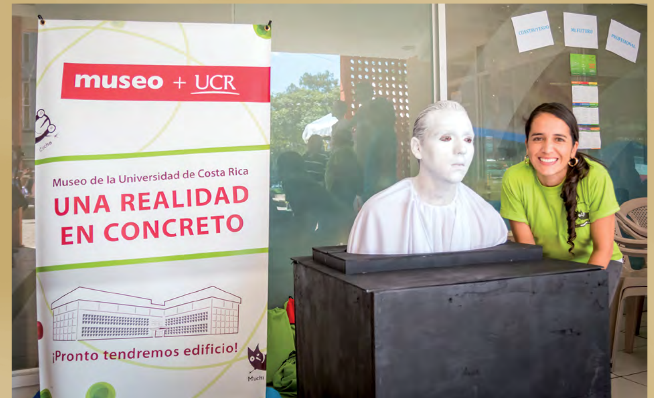
Foto 13. Celebración del quinto aniversario del museo+UCR (junio 2015). Presentación de estatuas humanas, Teatro Girasol

El museo es por excelencia una institución educativa. Sus funciones y responsabilidades primordiales tienen que ver con este quehacer. Una de las preocupaciones de la Universidad de Costa Rica es mantener sus colecciones en las mejores condiciones, para realizar actividades y programas que la sociedad pueda disfrutar y beneficiarse de estas. De esta forma, se cumple con uno de los principios de la Institución, es decir, el compromiso y la proyección social, particularmente con la educación.