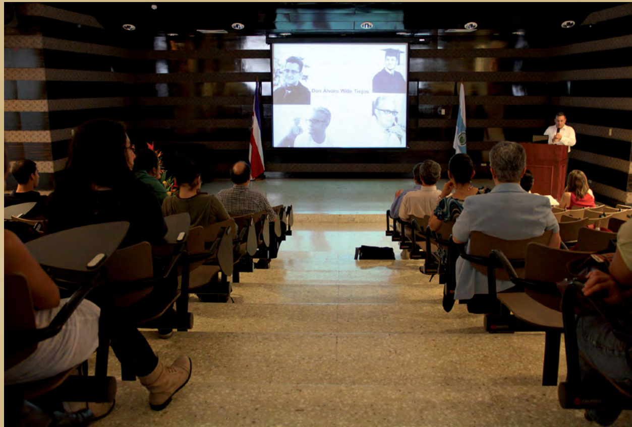
Foto 2. Simposio “50 años del Museo de Insectos” (octubre 2012). Actividad organizada por el Museo de Insectos y el museo+UCR.

Cabe indicar que desde los planteamientos conceptuales que le dieron vida al MINCI, comenzó a esbozarse y a tomar forma un proyecto más amplio y ambicioso: la creación del museo+UCR ; en otras palabras, el MINCI ha sido un antecedente fundamental para el museo+UCR .