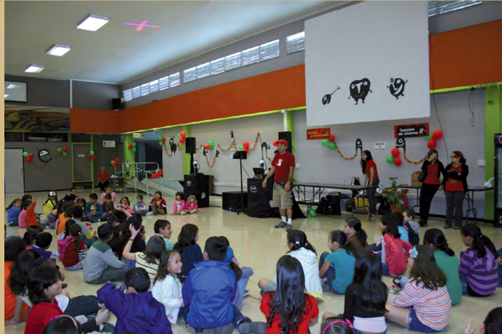
Foto 14. Fiesta navideña del museo+UCR. Comedor universitario (diciembre 2010).

curriculares, ubicación en nivel escolar, grupos escolares o familiares, visitantes en grupos o individuales y necesidades especiales. De esta manera, los programas educativos se adaptan a los requerimientos de los usuarios que demandan y necesitan actividades educativas.