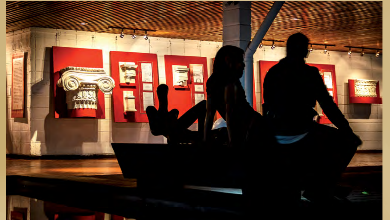
Foto 8. Exposición "Proporción, belleza y exceso: relieves y detalles arquitectónicos de la colección más antigua de la UCR", Galería de la Escuela de Artes Plásticas (24 de setiembre al 9 de noviembre del 2013). Esta exhibición fue curada y diseñada por la Escuela de Artes Plásticas y el museo+UCR.

No puede haber una instancia de educación superior pública que no esté claramente comprometida con la conservación de sus colecciones naturales y socioculturales, manifestaciones concretas de un quehacer humano complejo, largo y diverso, el cual continuará siendo posible si hoy cuidamos lo de ayer y mañana lo de hoy. Así, contribuiremos a preservar nuestra historia y el planeta.