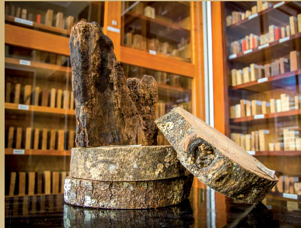
Foto 6. Colección de maderas de la Unidad de Recursos Forestales (antiguo Laboratorio de Productos Forestales) de la Facultad de Ingeniería.

sus tres funciones primordiales: docencia, investigación y acción social, así como de estudio, reflexión, creación artística y difusión del conocimiento.” (La definición de museo que nos brinda el ICOM se adecua a esta misión).