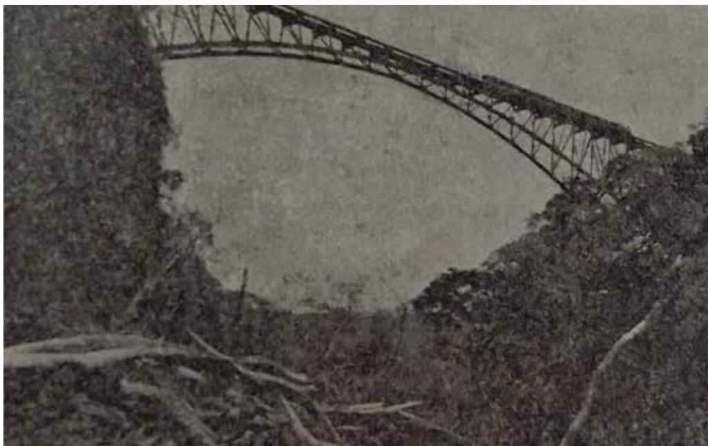
Imagen 5: Puente ferroviario sobre el Río Grande.

nueva provincia –situada en una hermosa altiplanicie al O. del Río Grande y al E. de la línea divisoria que separa la cuenca de este río de la del Barranca...” (Segarra y Juliá, 1907: p. 520).