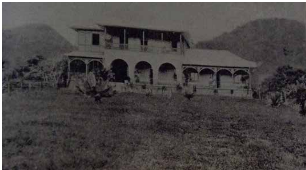
Imagen 3: Hacienda propiedad de Mr. Wahle en Cachí.

Las temperaturas son un poco menos intensas en el valle de Ujarraz, en uno de sus poblados en Cachí, aunque según los autores de Excursión por América, Costa Rica, es “sofocante el calor de las horas meridianas” (Segarra y Juliá, 1907: p. 446). Allí se encuentra la hacienda propiedad de Mr. Wahle dedicada al cultivo del café