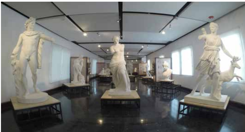
Foto 4. Vista general de la exposición

La colección de yesos traídos de Francia para el desarrollo de la Academia de Bellas Artes cuenta también algo de la historia de la universidad. Es importante resaltar en esto el esfuerzo del Museo de la Universidad de Costa Rica (museo+UCR) y de la Escuela de Artes Plásticas. La exposición exhibida en el Museo Nacional de Costa Rica es así mismo una gran oportunidad, para que el pueblo costarricense conozca y valore esta herencia y comprenda los esfuerzos emprendidos, desde hace muchos años en pro del desarrollo cultural nacional.