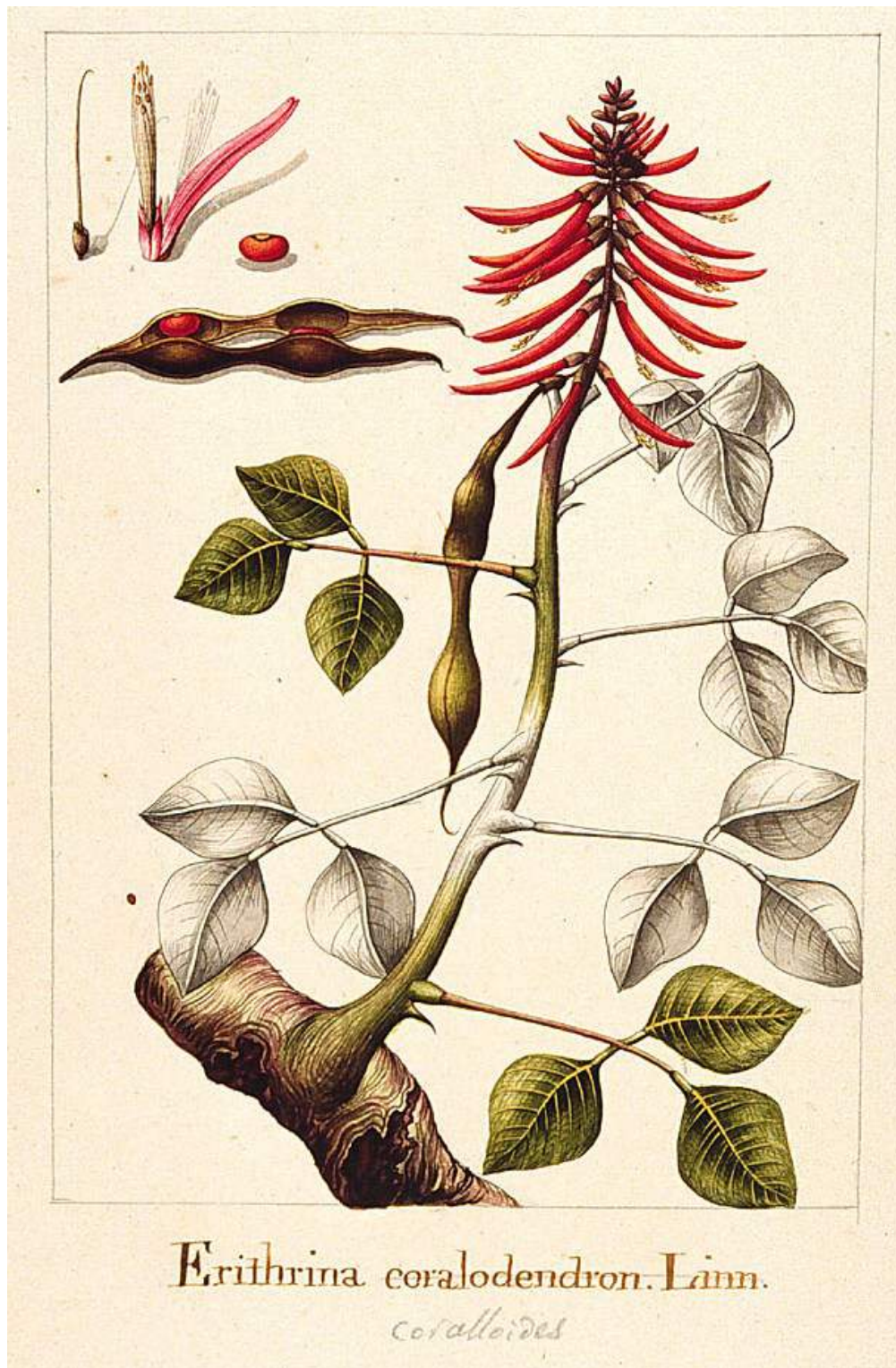
Figura N° 2. E. corallodendron , dibujada en la expedición de Sessé y Mociño.