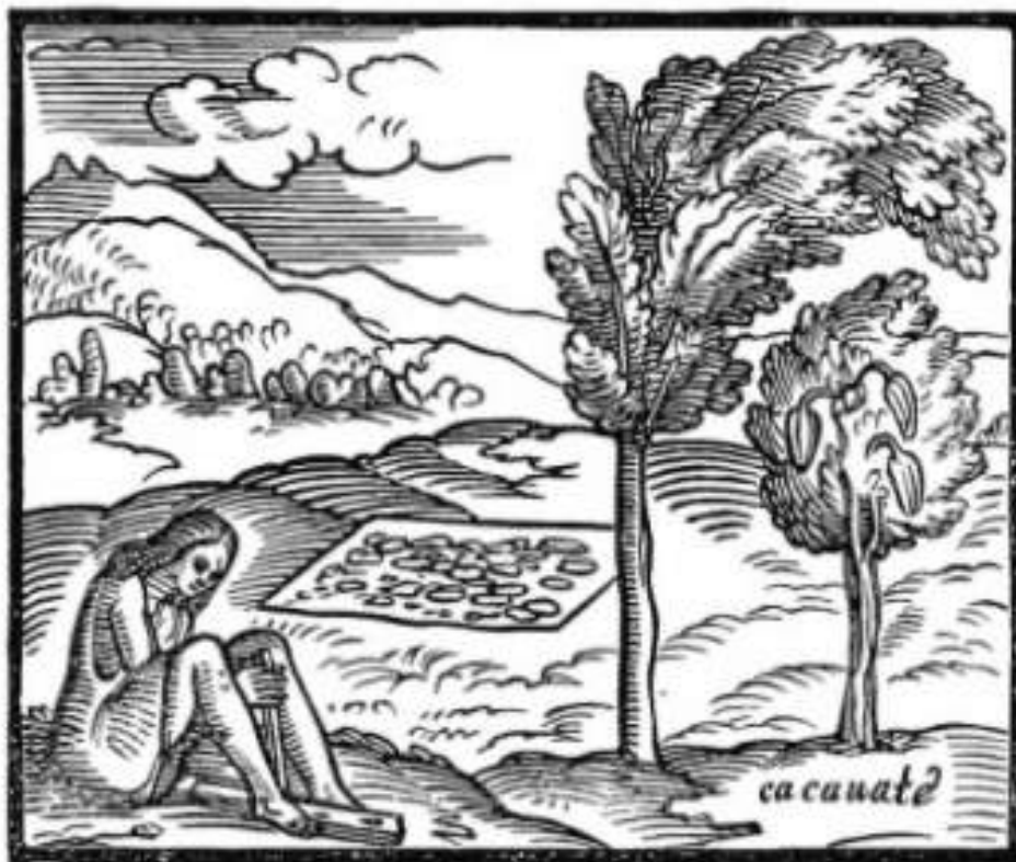
Figura N° 4. Árbol de madero negro al lado de un arbusto de cacao (cacauate), según Benzoni.

Finalmente, en congruencia con este relato, el sacerdote y cronista José de Acosta, que recorrió América del Sur entre 1571 y 1586, diría del cacao que