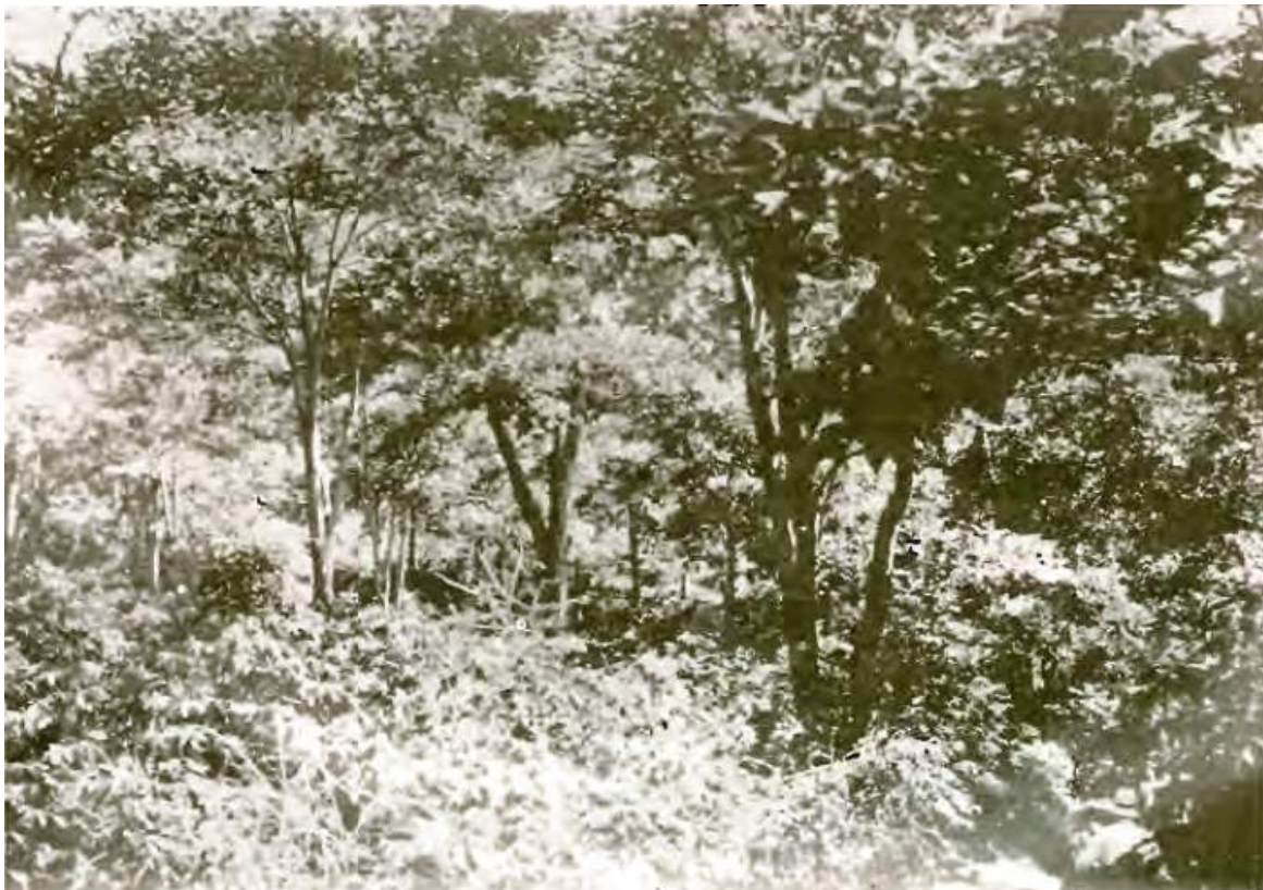
Figura N° 8. Plantación de café con sombra de poró gigante, en Juan Viñas.

Es oportuno aclarar que 13 años después, Montealegre publicó un artículo con exactamente el mismo título de su artículo de 1925, pero mucho más rico en información, gracias a las nuevas experiencias acumuladas en ese lapso; por su extensión, debió publicarlo en dos entregas (Montealegre, 1938a, 1938b). En él se reiteran aspectos de su artículo previo, pero también -sobre todo en el segundo- se discuten datos inéditos, de gran valor para entender cómo se diseminó y adoptó el poró gigante como árbol de sombra en el país, los cuales se complementan con dos fotografías muy reveladoras: una de un arbolito de tan solo cinco meses con excelente crecimiento, y otra de un cafetal sombreado con poró gigante (Figura N° 8).