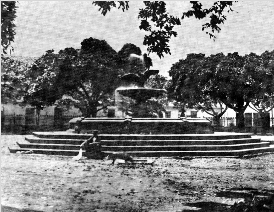
Figura N°1. Fuente Cupido y el Cisne en sus inicios, en la plaza Principal de San José. Autor desconocido. Década de 1870.

Primero, la Municipalidad pretendió donarla al nuevo Aeropuerto, construido en la Sabana (Núñez, 1944). Sin embargo, las autoridades universitarias se enteran de este propósito y la pidieron a la Municipalidad, que accedió donarla a la institución.