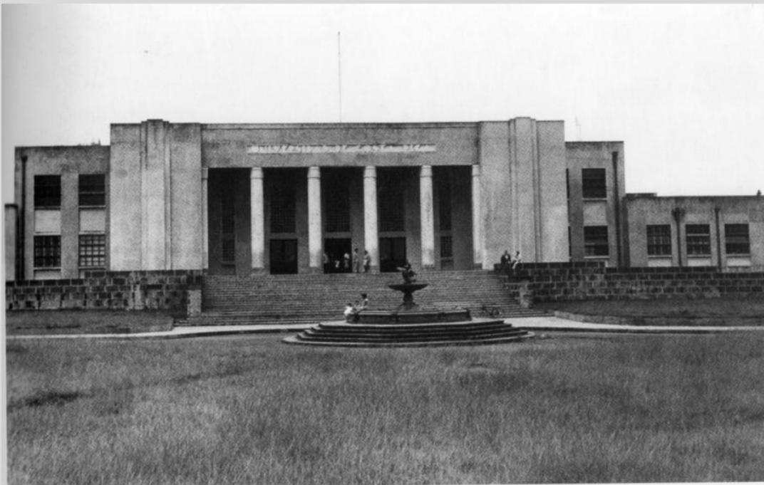
Figura N°2. Fuente Cupido y el Cisne en la Universidad de Costa Rica, barrio González Lahmann. El edificio frontal era la Sala Magna, también conocido como Paraninfo. La zona llena de césped, al oeste de la fuente era conocida como el Potrero de los Gallegos.