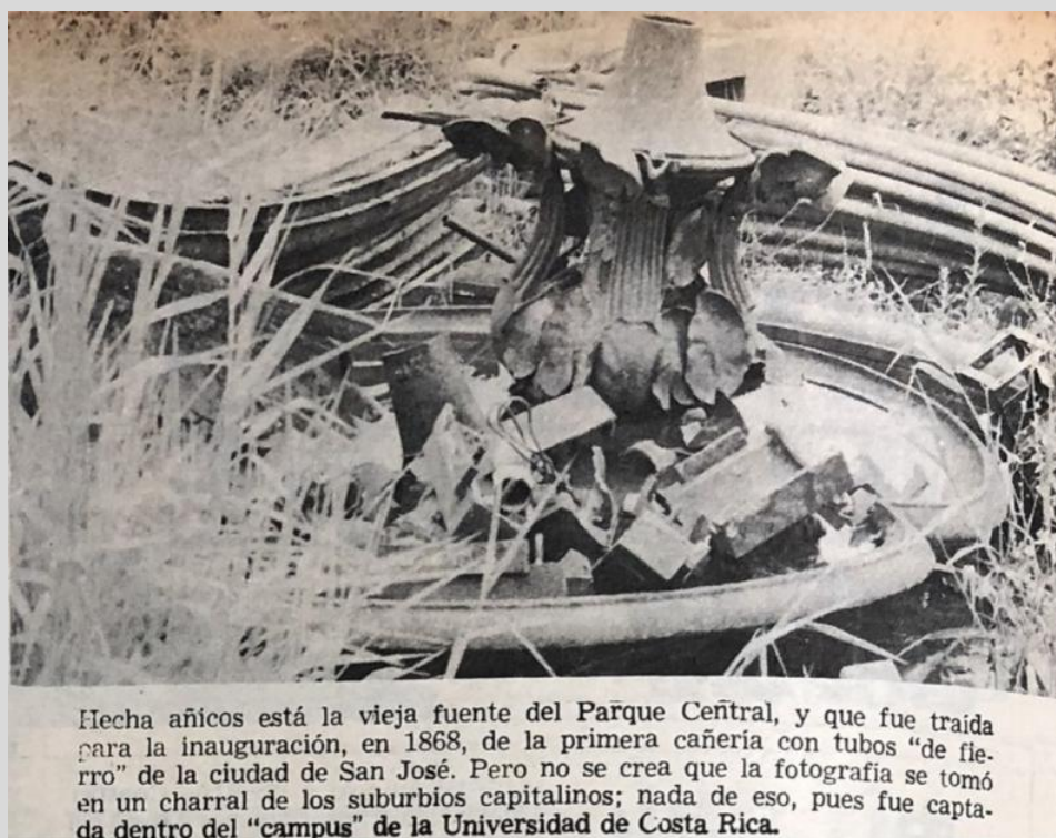
Figura N°6. Detalle de los trozos de fuente tirados en el predio, al oeste de los talleres de carpintería y transportes.