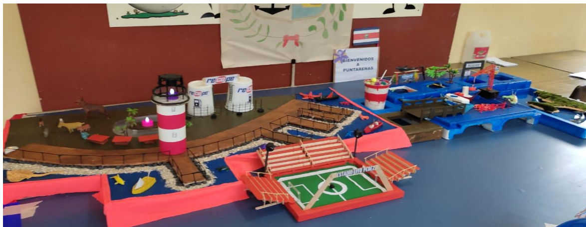
Imagen 10. Maqueta alusiva a la provincia de Puntarenas

En la maqueta que se relaciona con la provincia de Guanacaste (figura 9), se expone el proceso de transformación de la zona, pero conservando todo su sentido cultural. Se observa la típica casa de la zona, la representación de La Casona de Santa Rosa, que recuerda la gesta heroica del año 1856, el desarrollo turístico y la belleza de las playas. Se representa tanto el patrimonio cultural como el patrimonio ambiental y turístico.