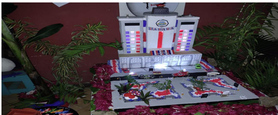
Imagen 5. Maqueta alusiva a la provincia de San José

Con la investigación y los materiales preparados, se inicia el tiempo de la confección de la maqueta para el cual se establece un horario que debe ser respetado y en el que cada miembro del grupo debe dar su aporte. La fecha de finalización de la obra es el día 14 de setiembre a medio día porque a las 6:00 PM, luego del canto del Himno Nacional, se procede a la exposición del proceso de confección, así como a las dificultades encontradas, los logros obtenidos, pero principalmente se expone el aprendizaje adquirido para el proceso de rehabilitación personal y grupal. A continuación, se ilustran las maquetas ya terminadas