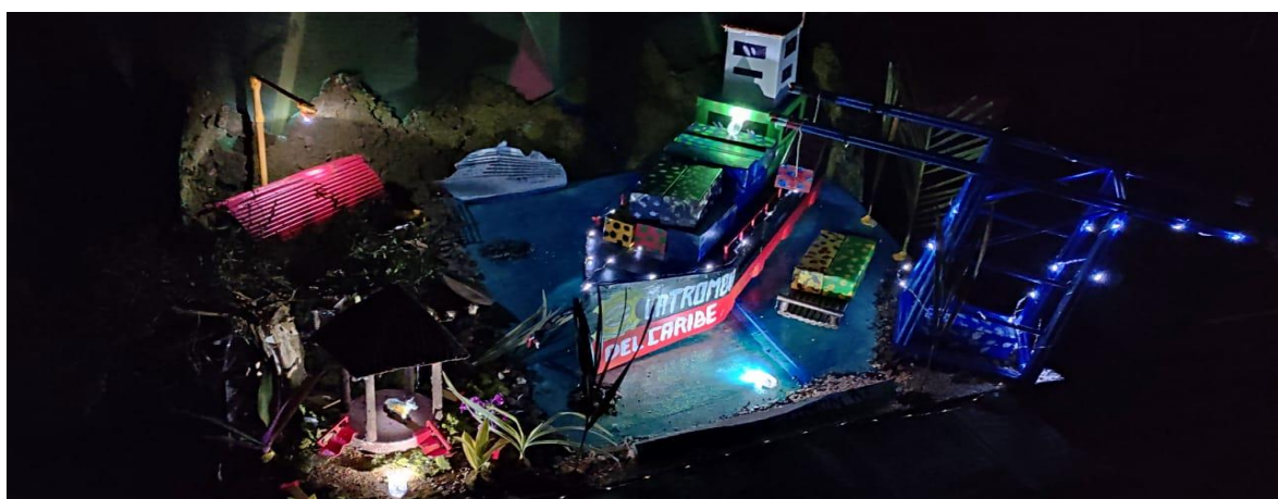
Imagen 11. Maqueta alusiva a la provincia de Limón

El Patrimonio Cultural representado en la maqueta alusiva a la Provincia de Puntarenas (imagen 10), ofrece detalles muy significativos de la provincia: el color azul del esplendoroso mar, el faro que engalana la punta de la ciudad, el mítico estadio de Puntarenas, conocido como la olla mágica, el indiscutible Churchill, y el desarrollo económico de la zona representado en el Puerto de Caldera.