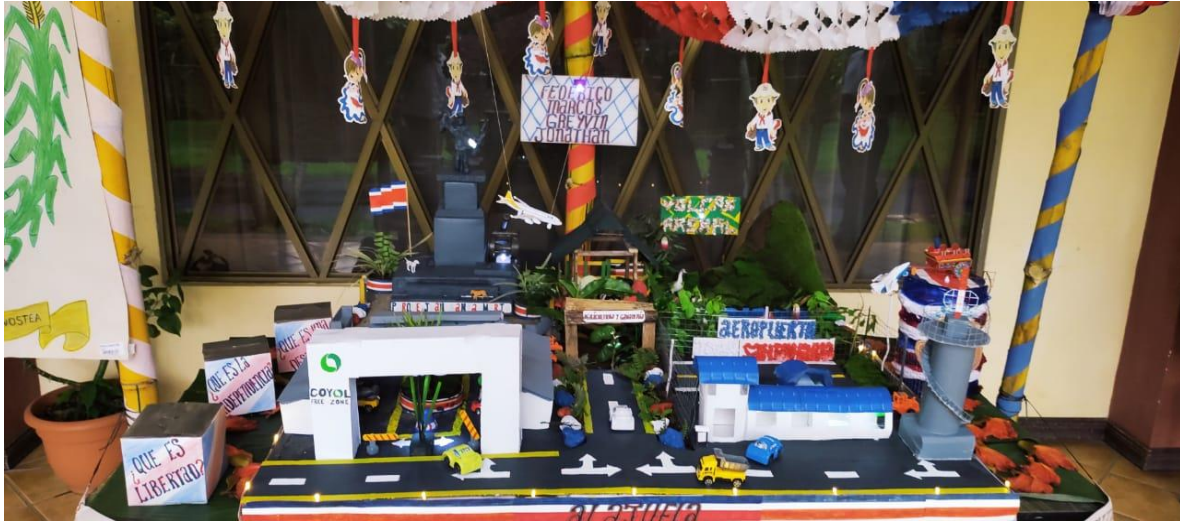
Imagen 6. Maqueta alusiva a la provincia de Alajuela

La imagen 5 expone la maqueta alusiva a la provincia de San José, en específico el edificio del Banco Nacional y un detalle del parque que está a la par de Banco Central. Los usuarios que realizaron esta maqueta frecuentaban las cercanías de la zona ilustrada.