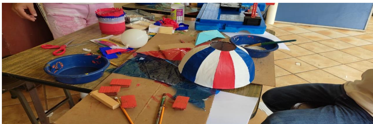
Imagen 3. Preparación de materiales