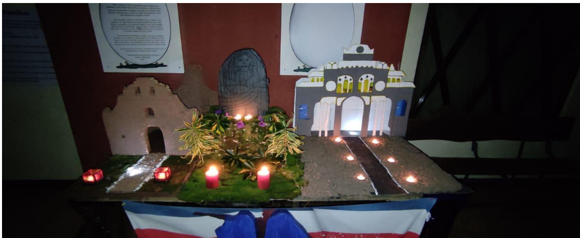
Imagen 7. Maqueta alusiva a la provincia de Cartago

La imagen 6, correspondiente a la provincia de Alajuela, resalta cuatro elementos: el desarrollo económico de la zona del Coyoil, la imagen de Juan Santamaría (héroe nacional), el aeropuerto Internacional y la zona norte de la provincia con los colores verdes y las figuras del parque de Zarcero. Téngase presente que estos lugares son también frecuentados por quienes confeccionaron esta manualidad.