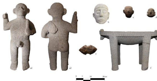
Imagen 6. Parte de la escultórica recuperada en el sitio Pascua. Composición basada en la Figura 73 (Naranjo et al., 2015, p. 155). a. Personaje representando la toma de cabezas (vista anterior y posterior); b., c. y d. cabezas efigie; e. Hacha doble acinturada dentada; f. Metate tetrápode decorado con estilizaciones de cabezas. a., b., e. y f. forman parte del mismo ajuar del contexto “RF2”; mientras c. del “RF12” y d. del “RF16”.

En síntesis, para el “RF2” (la sepultura compuesta) se halló en asocio una representación explícita de toma de cabezas (la cabeza escindida cuelga de la espalda de un personaje), una escultura de cabeza en bulto, un metate decorado y un hacha dentada; de los que se discutirá más adelante (imagen 6). Valga decir que el segundo objeto, el cual posee una base cilíndrica y plana, es descrito como “una cabeza trofeo” y cuyo corte de cabello fue “ejecutado por el captor como símbolo de dominación sobre su enemigo” (Naranjo et al., 2015, p. 151).