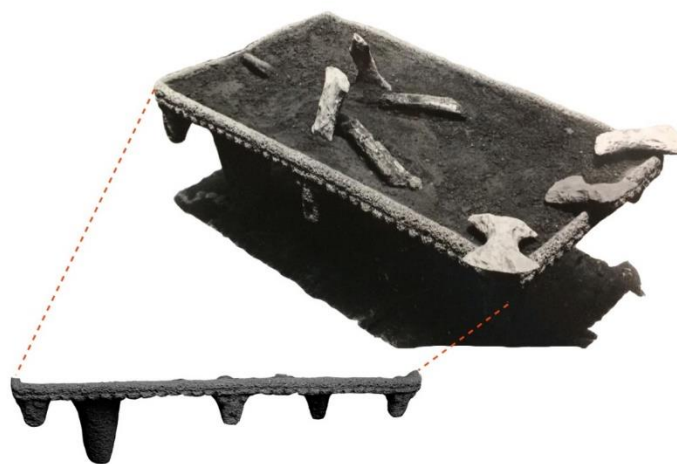
Imagen 7. Metate decorado con estilizaciones de cabezas en su borde y en cuyo plato se hallaron hachas enmangadas en fémures humanos, sitio CENADA (H26-CN).

Más allá de la simbolización y metaforizar la toma de cabezas (vía su representación esculpida en los bordes de los metates), no deja de llamar la atención hallazgos sorprendentes como el del sitio CENADA (H26-CN), localizado en Barrial de Heredia (imagen 7).