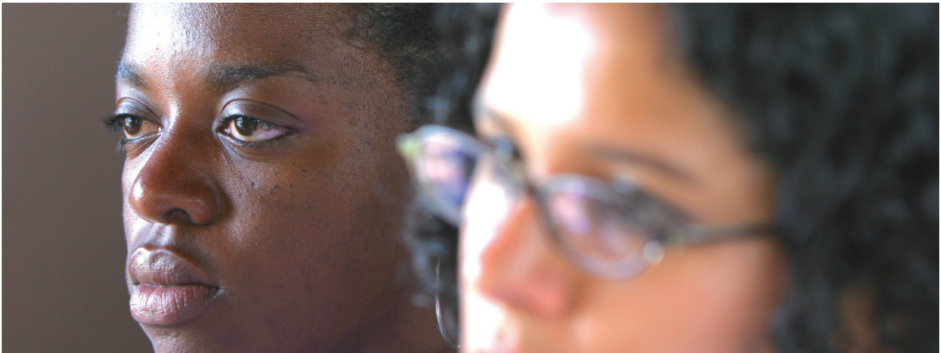
La Universidad de Costa Rica promueve la Ley de Igualdad de Oportunidades mediante talleres de sensibilización.

Estudiantes universitarios de diversas disciplinas, de las áreas de Ciencias Sociales, Ciencias de la Salud, Ciencias Básicas e Ingenierías.