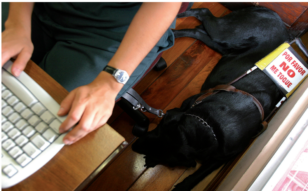
Se ofrecen servicios de apoyo académico a las personas con discapacidad.