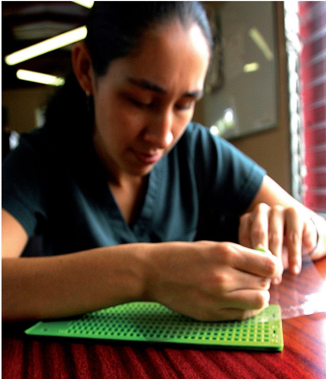
El MUFES es un centro interactivo, formativo y recreativo.

Comunal leyéndole a un estudiante ciego: