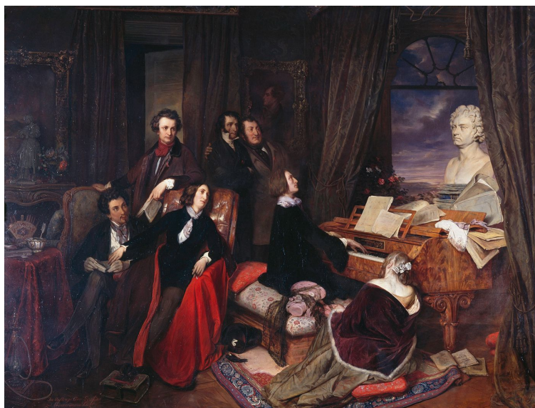
FIGURA 2 Danhauser, Liszt au piano (1840)