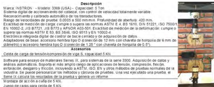
Figura 1. Características de la máquina universal utilizada para las pruebas.

La máquina universal de ensayos utilizada para realizar los diferentes ensayos posee las características mencionadas en la figura 1.