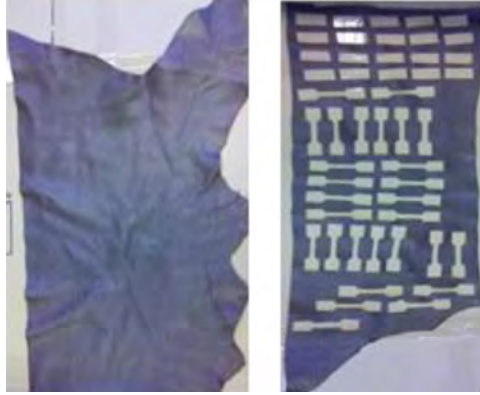
Figura 4. Muestra de cuero fino de vaca utilizado para la confección de las probetas.

Se preparan las probetas aplicando el sacabocado en la superficie de la flor. Estas fueron cortadas a través de las maquina universal, utilizando compresión (figura 5) para lograr un corte rápido y parejo.