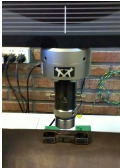
Figura 5. Preparación de probetas para el corte.

Se preparan las probetas aplicando el sacabocado en la superficie de la flor. Estas fueron cortadas a través de las maquina universal, utilizando compresión (figura 5) para lograr un corte rápido y parejo.