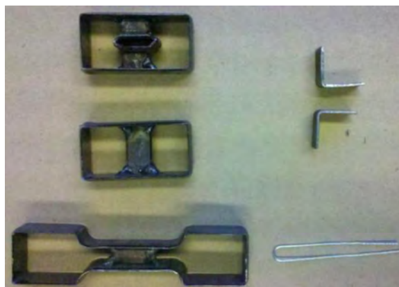
Figura 3. Sacabocados.

Los sacabocados fueron confeccionados por el área de mantenimiento de la misma empresa proveedora de los cueros, de acuerdo a las normas establecidas IRAM 8511 (2006), IRAM 8513 (2006) e IRAM 8514 (2006) (ver figura 3).