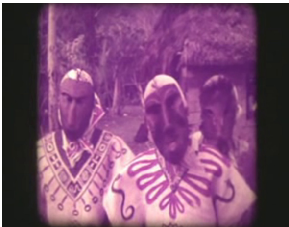
Fotografía 1. Imagen de la Fiesta de los Diablitos de 1966. Tomada de la película Viaje a la tierra de Boruca , de Miguel Salguero.

Sin embargo, la opinión de Federico Guevara (2008) es por completo contraria a esta idea. Para este autor, la Fiesta de los Diablitos no es la base de la identidad indígena boruca. Si bien es cierto, constituye un fenómeno importante para dicho pueblo, es un rasgo que no es primordial. Más bien, es un recurso cultural, posiblemente el principal, que ha sido instrumentalizado de forma consciente por la sociedad boruca. No obstante, la fiesta no constituye el motor de la dinámica cultural de dicho pueblo. Para Guevara, dicho papel lo cumplen la tradición y el conocimiento ancestral. De acuerdo con esto, “la tradición oral brunca ha sido, y sigue siendo, fundamento para la diferenciación étnica. Es esta misma, por ende, una frontera étnica” (Guevara 2008, 154).