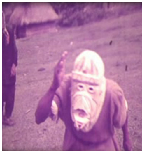
Fotografía 4. Primer plano de una máscara de diablito. Tomada de la película Viaje a la tierra de Boruca (1966), de Miguel Salguero.

No obstante lo anterior, se pueden señalar algunos aspectos sociales relevantes con respecto a la fiesta y a la comunidad que se evidencian en este documental. En primer lugar, se aprecia poco público en la fiesta. Se nota de forma contundente que no se trata de un espectáculo masivo. Aparentemente, los habitantes del pueblo esperaban a que los diablos llegaran a sus viviendas en lugar de ir tras ellos o congregarse en un punto fijo. Además, la fiesta tiene un carácter comunal, pues la presencia de público foráneo es mínima. Por otro lado, el evento se desarrolla con mucha sencillez 13 . Está claro que no tiene pretensiones de espectáculo. De hecho, tanto los trajes como las máscaras son poco ostentosos y se aprecia que los recursos son limitados, por ejemplo, se usan sacos de gangoche como vestimenta y las máscaras, que no están pintadas, tienen un diseño rústico. Estas últimas, en varios casos, representan animales salvajes, como el mono, tal y como se aprecia en la FOTOGRAFÍA 4.