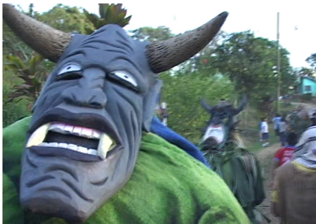
Fotografía 8. Primer plano de una máscara de diablito. Tomada de la película Rabrũ (2005), de Roberto Román Vila.

De esta forma, el documental muestra la otra cara de la realidad cultural, no solo está la Fiesta de los Diablitos, también existen bailes con música electrónica donde los jóvenes bailan breakdance y reggaetón , entre otros elementos que ilustran los cambios culturales que vive en la actualidad la sociedad boruca.