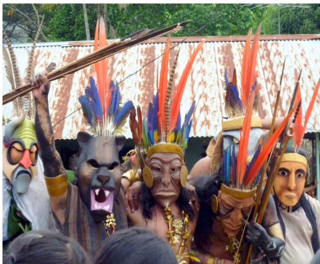
Fotografía 11. Plano general de los diablitos. Nótese la sofisticación de las máscaras portadas por ellos.

Finalmente, en los últimos años, ha surgido una idea estereotipada en torno a la complacencia del indígena que atrae este público foráneo. Esta tendencia llegó a su máxima expresión en el 2011 y 2012, años en los que los videos alojados en internet muestran que los diablitos salieron vestidos con taparrabos y penachos de plumas.