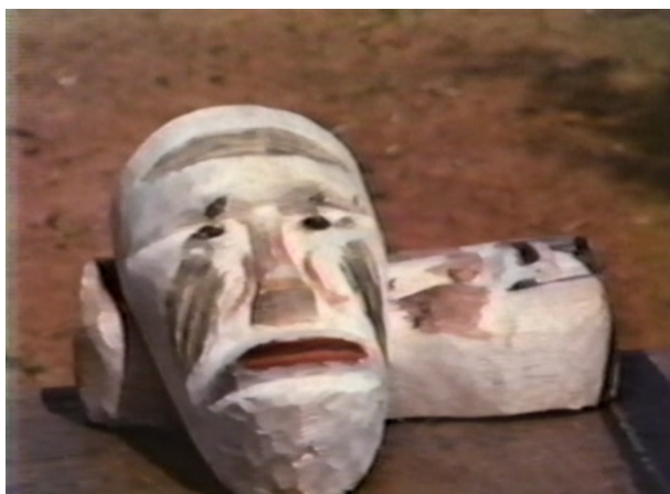
Fotografía 6. Primer plano de una máscara de diablito.

Desde un punto de vista social, el video da cuenta de que existe un público numeroso que asiste a ver la actividad. Entre ellos, se notan varias personas foráneas. Esto es señal