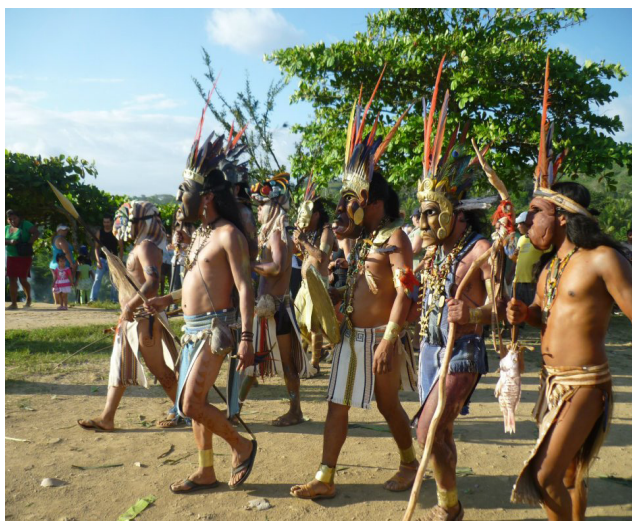
Fotografía 10. Desfile de los diablitos antes del enfrentamiento con el toro. Nótese el uso de los taparrabos y los penachos de plumas.

Para efectos de este trabajo, se analizó un corpus de 31 videos con imágenes alusivas a la fiesta. Se tomaron en cuenta todos aquellos que al respecto se encontraban alojados en el sitio web Youtube.com. Se escogió este sitio debido a que, en nuestro medio, constituye la forma más popular de compartir videos mediante internet. Se sobrentiende que es dicho sitio el que va a arrojar una mayor cantidad y variedad de videos. En él existen videos de la fiesta desde el 2008 hasta la actualidad.