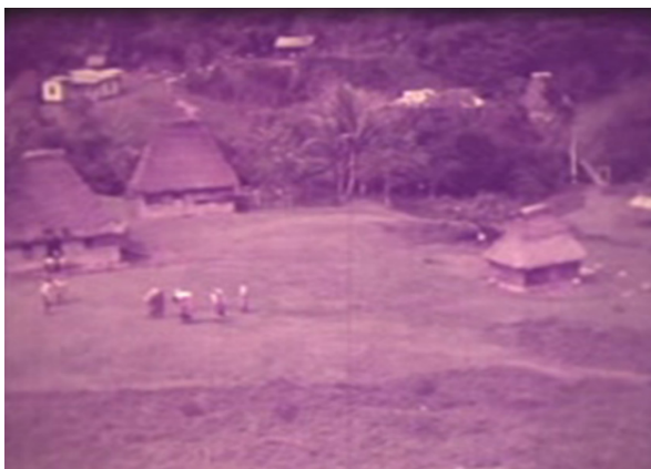
Fotografía 3. Plano general del enfrentamiento entre el toro y los diablitos. Tomada de la película Viaje a la tierra de Boruca (1966), de Miguel Salguero.

Como se dijo, Viaje a la tierra Boruca (1966) constituye la primera grabación de esta festividad. Fue hecha por Miguel Salguero, conocido periodista costarricense, cuya especialidad ha sido exponer las tradiciones populares y folclóricas del país 12 . La obra tiene el mérito, no solo de ser pionera en su campo, sino de mostrar con respeto un ambiente cultural que, para la mayoría de la población del Valle Central costarricense de aquella época, era desconocida por completo. Sus imágenes, además, tienen un valor incalculable, pues permiten hacerse una idea de como era la comunidad de Boruca en aquel momento y como se llevaba a cabo la fiesta, lo cual, a su vez, sirve de parámetro para conocer la evolución de esta celebración.