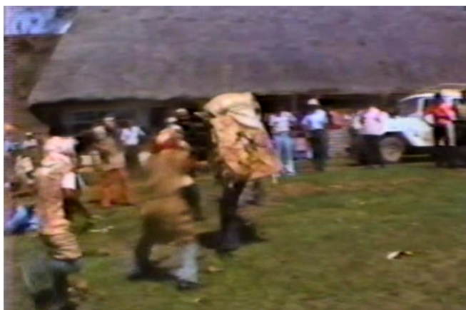
Fotografía 5. Plano general del enfrentamiento entre el toro y los diablitos. Tomada de la película Los indígenas de Costa Rica (1985).

todos los pueblos indígenas de la Zona Sur de Costa Rica. La obra se conserva en la Biblioteca Carlos Monge Alfaro de la Universidad de Costa Rica y, desafortunadamente, no posee créditos. Se trata de un material audiovisual con pretensiones educativas. De hecho, se realizó como parte de la conmemoración del Día