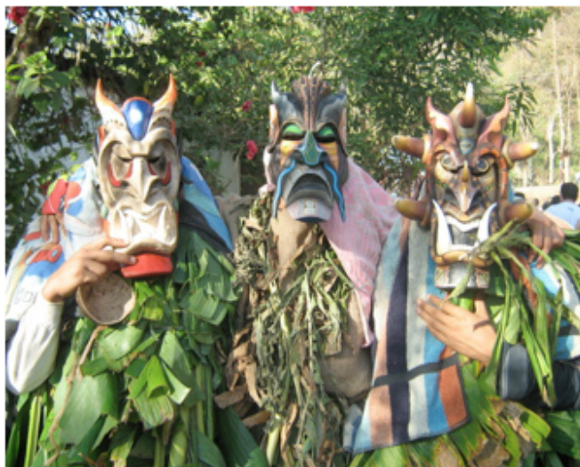
Fotografía 2. Imagen de la Fiesta de los Diablitos del año 2012.

Desdehacedosdécadas, la fiesta también se realiza en Curré a finales de enero y principios de febrero 11 . Existe una somera descripción de la fiesta hecha por Doris Stone (1949, 29). Una descripción