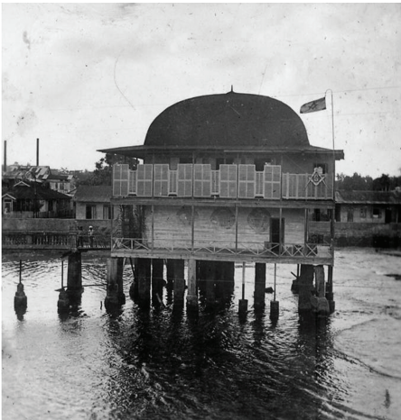
Templo masónico de la logia Unión Fraternal de Puerto Limón.

las formas de sociabilidad de esta ciudad. A Puerto Limón llegaron europeos de las más diversas procedencias, estadounidenses, latinoamericanos y criollos del Caribe afrodescendientes, 15 quienes construyeron y desarrollaron una ciudad de Puerto Limón más liberal, progresista, modernista y cosmopolita que muchas otras del país, hasta el punto de que ésta se encontró preparada para organizar y fundar sociedades de ideas. 16