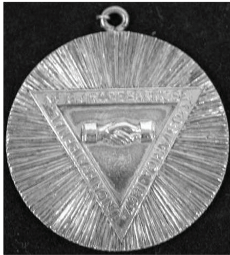
Escudo de la logia Unión Fraternal de Puerto Limón, organizado en 1892.