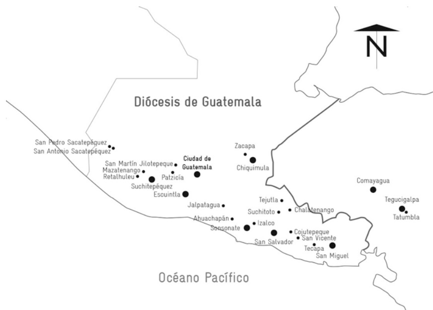
Figura 2. Localidades citadas. Siglos XVIII y XIX