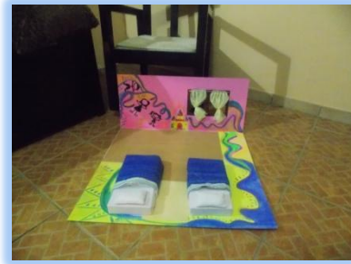
Parte del resultado de investigación de Tracy Chacón en el curso de Preescolar. Sentir texturas dentro de las camitas, un niño al que se le construyó un medio de transporte tipo patineta.