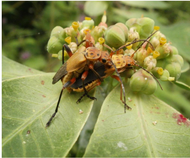
Figura 3. Chauliognathus forreri Gorham, 1885.