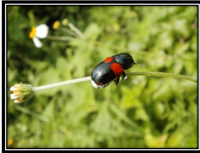
Figura 2e Muestra de imágenes del estado de Morelos