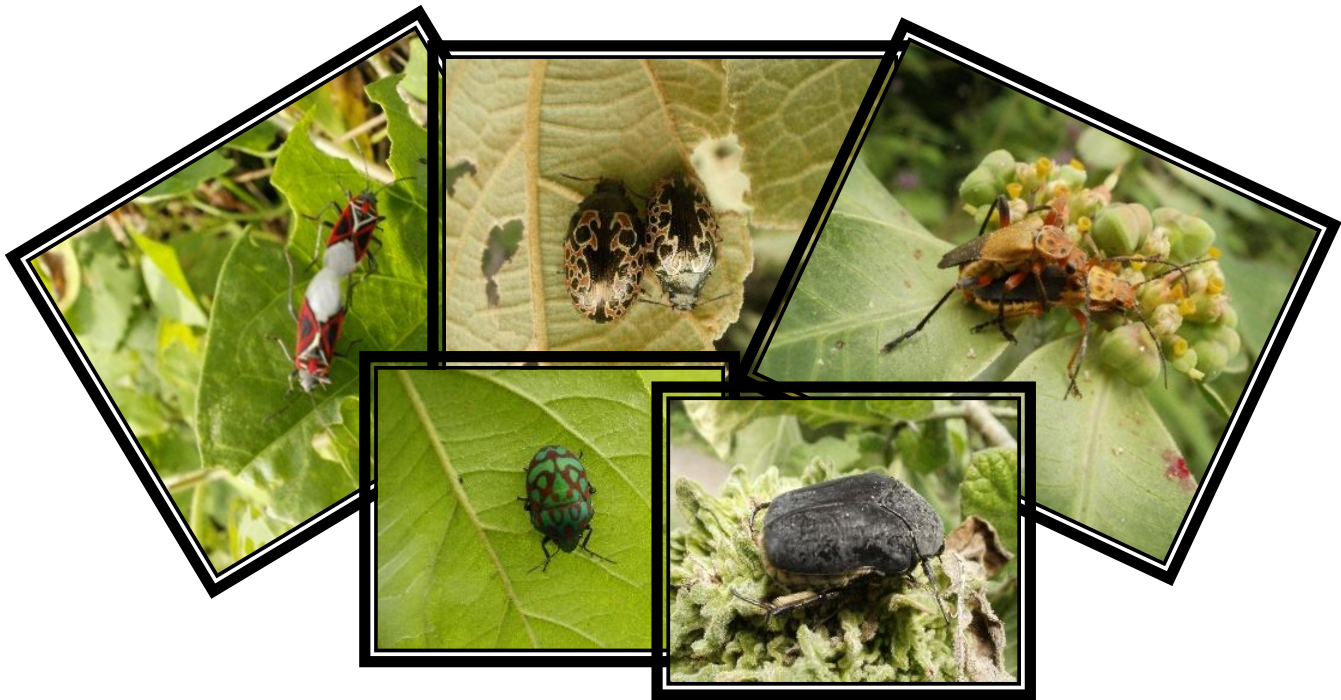
Figura 2a Muestra de imágenes del estado de Morelos

Como se mencionó con anterioridad el material con el que se cuenta son videos e imágenes tomadas con una cámara Olympus 52-14 de 14 mp y 24 x, que en su primera etapa sólo incluirá al estado de Morelos, en la Figura 2a-e se puede apreciar una muestra de éstos.