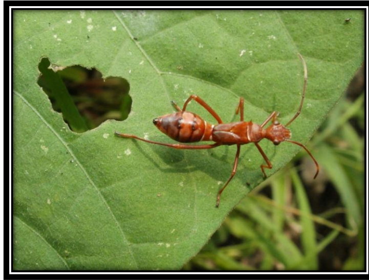
Figura 2d Muestra de imágenes del estado de Morelos