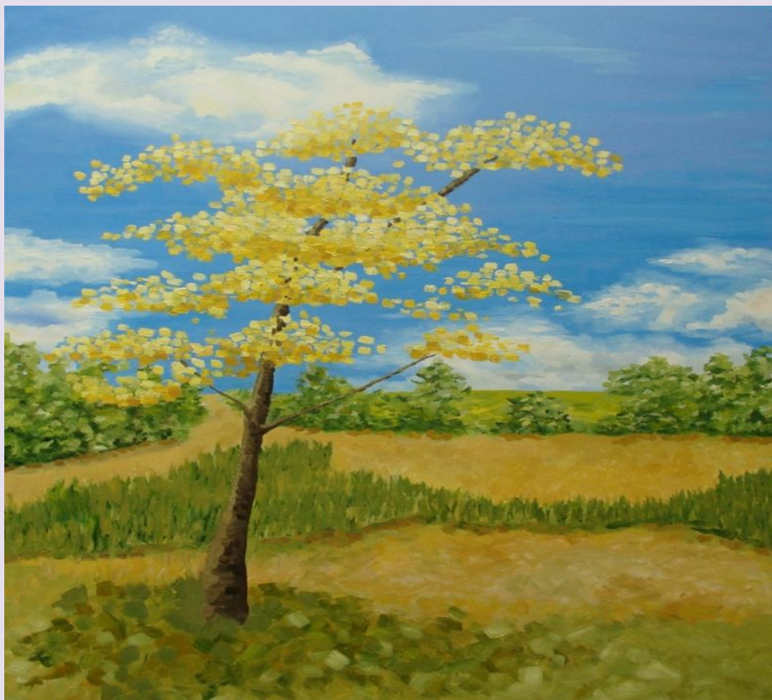
Cortés Amarillo. Oleo de Norma Varela

La sincronidad y los códigos: hilos de la Práctica Docente Supervisada