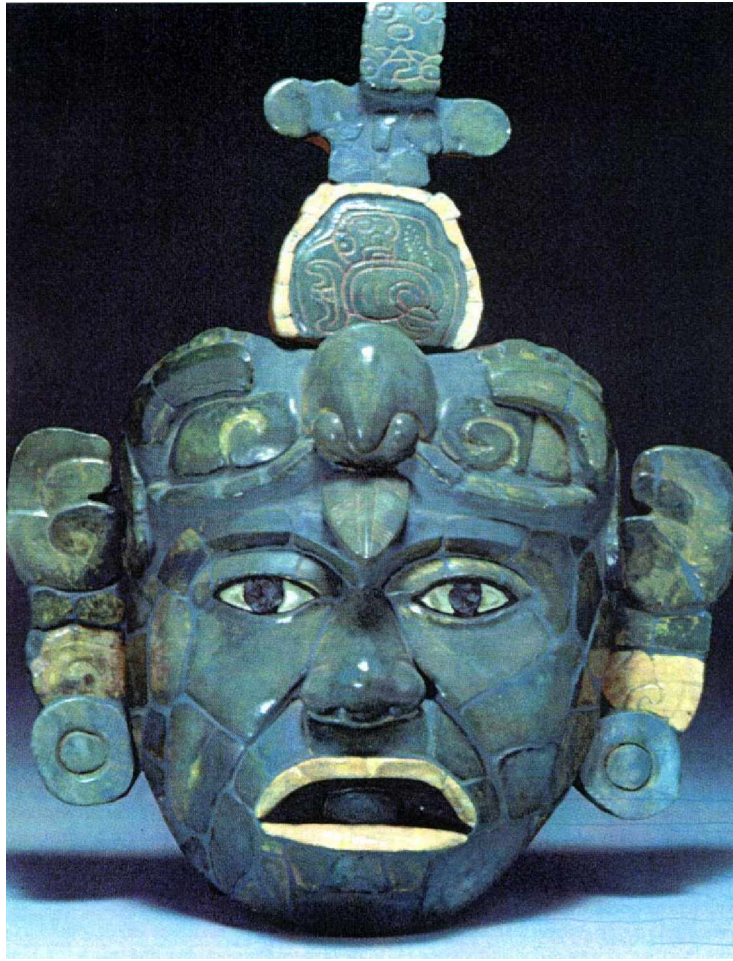
Máscara funeraria de una tumba de Tikal (Guatemala). Historia 16 (1999: 9)