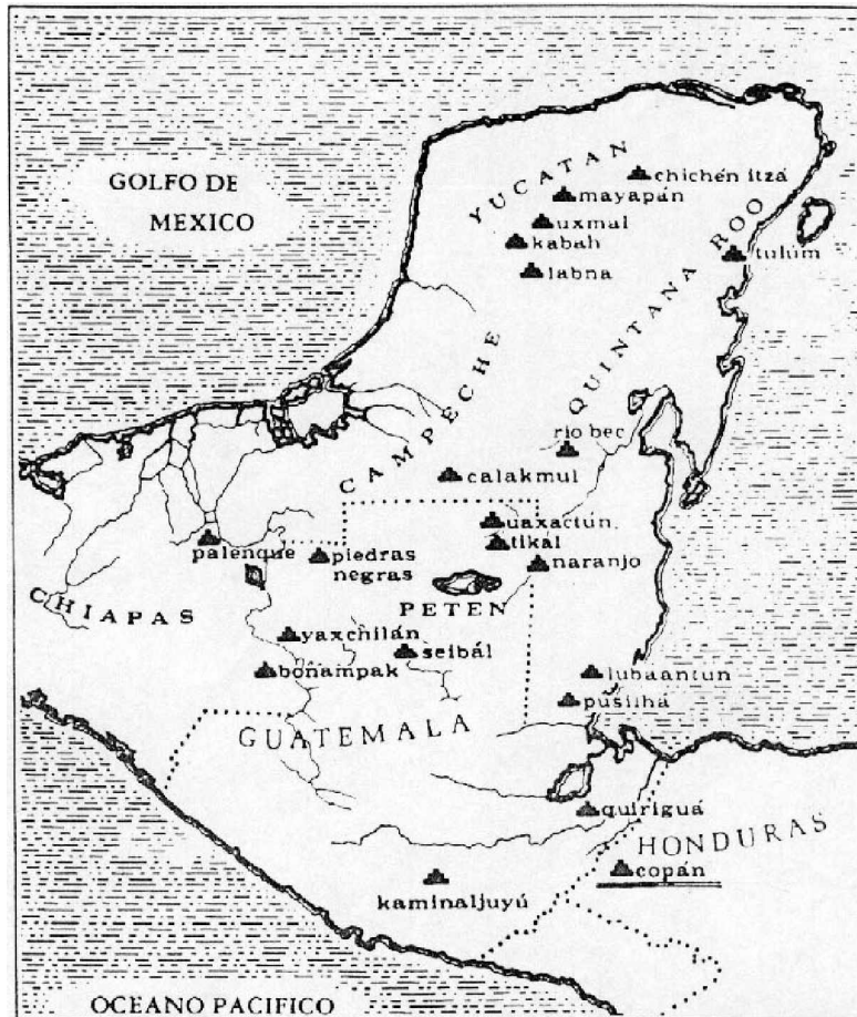
El mapa detalla los límites de Mesoamérica. La amplia zona geográfica abarca, según las divisiones políticas actuales, la mitad sur de México, todo el espacio de Guatemala y Belice y parte de Honduras y El Salvador. Allí floreció, en el período precolombino, la civilización maya, cuyas ciudades más importantes figuran también en este mapa (Chichén Itzá, Tikal y Copán, entre otras.)