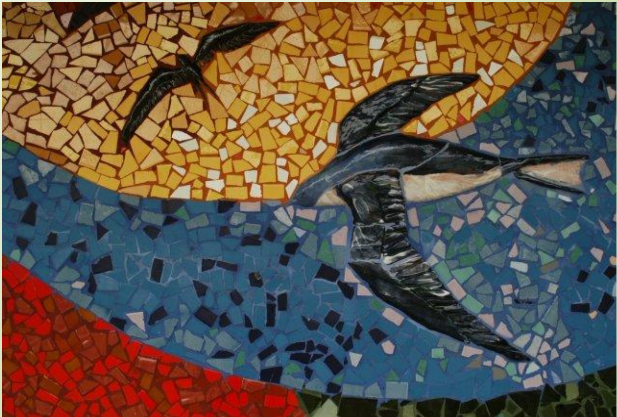
MURAL DE LA BIBLIOTECA DE LA SEDE DE LIMÓN

REVISTA ELECTRÓNICA DE LAS SEDES REGIONALES DE LA UNIVERSIDAD DE COSTA RICA