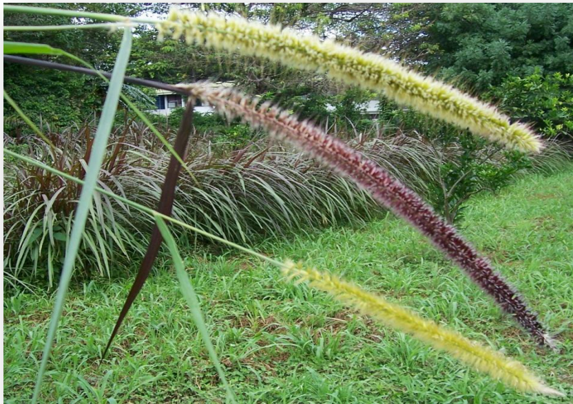
Flor del pasto Camerún comparada con las de otros Pennisetum, Liberia, Guanacaste