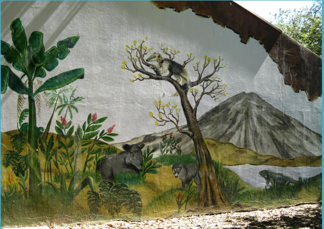
Mural de colectivo artístico de Guanacaste

Productividad del pasto Camerún ( Pennisetum purpureum ) con varias dosis de nitrógeno y frecuencias de corte en la zona seca de Costa Rica