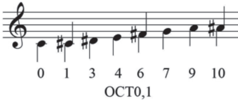
EJEMPLO 16 Reinterpretación de las áreas formales