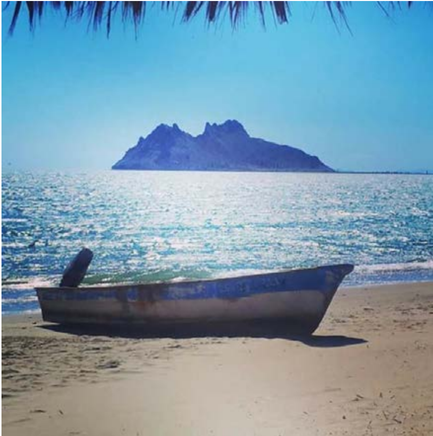
FIGURA 1. Isla Alcatraz 1