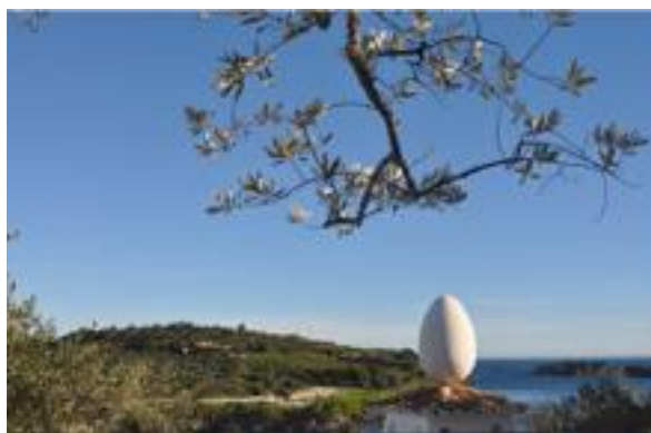
Figura 1. Vista desde la casa de Salvador Dalí.