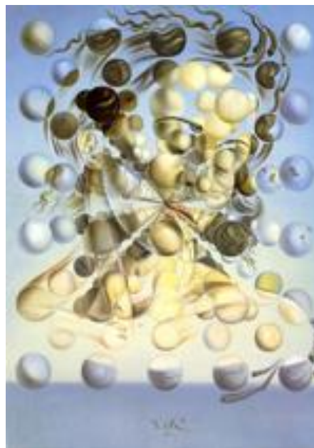
Figura 9. Galatea de las esferas . (Dalí, 1952).

En la parte superior de la cruz, en vez de la leyenda INRI aparece una hoja de papel, la dirección que establece la cruz y la cabeza de Cristo, mirando hacia abajo, conduce la vista hacia este paisaje idílico y calmado, que sirve de anclaje. Se nota un gran dramatismo en el Cristo suspendido sobre un horizonte bajo, característico en Dalí, así como su maestría en la ejecución de la obra, que conmueve y hace reflexionar. Con esta obra de arte, Dalí quiso ilustrar la resurrección de Jesús y su victoria sobre la muerte. Tal vez, por este motivo, el cuadro posee un fuerte poder comunicativo, simbólico y religioso.