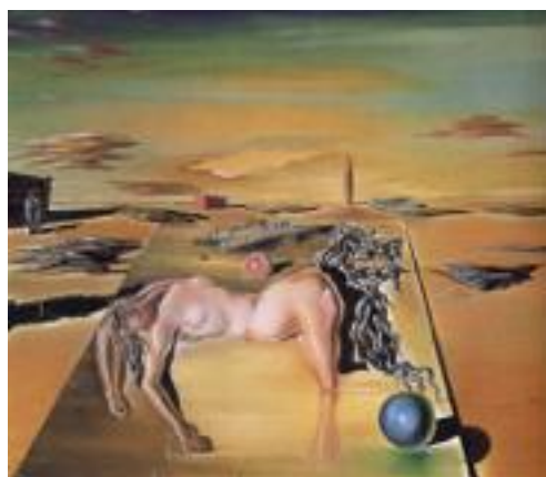
Figura 5. Invisible mujer durmiente, caballo, león. (Dalí, 1930).

De esta manera, se llega a otro concepto daliniano, que se debería considerar como una especificidad del método del artista individual: imágenes de figuración doble o múltiple, que dependerán del grado paranoico del autor. En este sentido, se puede mencionar que “es así cómo a través de esas imágenes dobles cada espectador verá unas u otras realidades en un cuadro de Dalí, dado que cada uno de nosotros interpretamos desde nuestro subconsciente” (Hernanz, s.f., párr. 4).