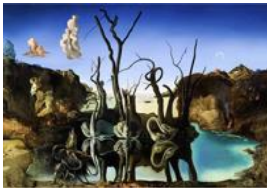
Figura 6. Cisnes que se reflejan como elefantes. (Dalí, 1937).

En la obra Cisnes que se reflejan como elefantes (Figura 6), se nota cómo Dalí recurre a ilusiones ópticas y a imágenes dobles; figuras ambivalentes que aparecen reflejadas sobre el agua. En su morfología establece un cierto orden en la colocación de los diversos elementos presentes, lo cual incorpora el equilibrio en la proporción de los mismos, con sus diferentes tamaños. La simetría por reflexión se rompe con la transmutación del reflejo de los cisnes en elefantes.