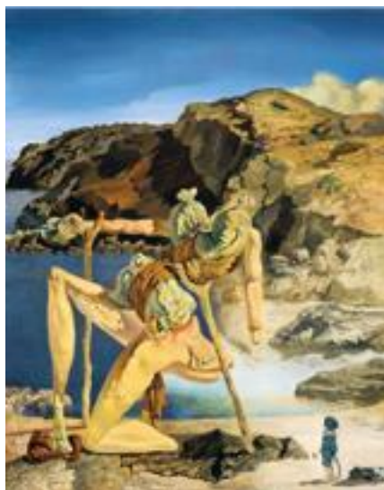
Figura 4. El espectro del sex appeal . (Dalí, 1934).

Con relación a El espectro del sex appeal (Figura 4), Dalí se inspira en el pasaje de Tudela, cercano al Cabo de Creus (Cadaqués). Un paisaje rocoso que forma parte de la Costa Brava, a orillas del Mediterráneo, el cual sirve de escenario para ambientar o construir un mundo nuevo alrededor del personaje que aparece en esta obra, el cual está desfigurado y en descomposición; se torna un monstruo blando y duro al mismo tiempo, no tiene rostro, se vuelve anónimo.