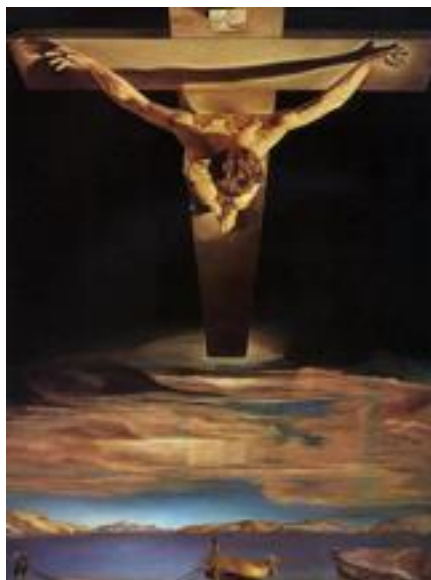
Figura 8. Cristo de San Juan de la Cruz. (Dalí, 1951).

Esta es una interpretación no convencional de la crucifixión, considerada como el máximo exponente de su etapa mística, cuyo acabado es un ejemplo de su técnica fotorrealista, que expresa la belleza y simboliza al Cristo redentor. El tipo de pincelada es muy fina, lo que le permitió reproducir los detalles más pequeños.