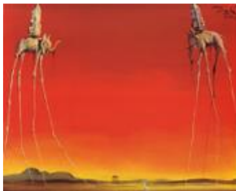
Figura 7. Los elefantes. (Dalí, 1948).

Dalí se inspira en sus sueños para crear mundos y personajes extraños, híbridos, cargados de simbolismos y dobles sentidos. En su obra Los elefantes (Figura 7), puede intuirse una oposición, entre peso y fortaleza del animal, y la fragilidad en sus extremidades que aluden a la inestabilidad y sensación de caída en el sueño.