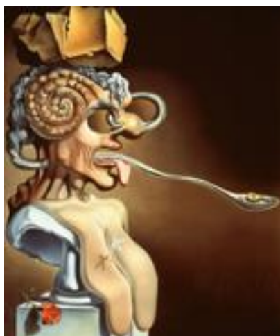
Figura 2. Retrato de Pablo Picasso en el siglo XXI . (Dalí, 1947).

La obra titulada Retrato de Pablo Picasso en el siglo XXI (Figura 2) es un primer ejemplo de una usurpación del código tradicional de la belleza como categoría estética. Dalí representa al pintor malagueño como un emperador, e incorpora en él una serie de elementos de manera irónica y fantástica, que conforman un marco alegórico, el cual pretende, de alguna manera, representar elementos consustanciales.