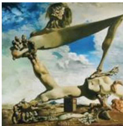
Figura 3. Construcción blanda con judías hervidas (Premonición de la guerra civil) . (Dalí, 1936).

Puede decirse que, como auténtica corriente de vanguardia, el Surrealismo rechaza todas las corrientes modernistas que apoyan los conceptos del naturalismo y realismo del siglo XIX, declarando abierta y definitivamente una corriente antirrealista; esto es, a grandes rasgos, la explicación a una buena parte del estilo en dicho movimiento.