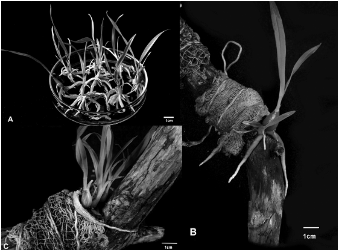
FIGURA 2. Establecimiento ex vitro de las plantas micropropagadas. A) plantas obtenidas a partir de mitades apicales y basales de protocormos de Euchile mariae . B) Montaje de las plantas micropropagadas sobre troncos de tepozán. C) Plantas de E. mariae después de 35 días en condiciones ex vitro .

ejerce en sus poblaciones silvestres y que a su vez, sirva como modelo para la propagación masiva de otras especies de orquídeas, que se encuentren amenazadas y/o en vías de extinción, contribuyendo a su conservación y aprovechamiento sustentable.