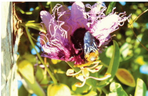
Fig. 6. Xylocopa sp. polinizando flor de maracuyá ( P. edulis f. flavicarpa ).