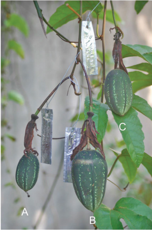
Fig. 1. Frutos de Passiflora vitifolia producto de la polinización cruzada con: A: P. platyloba ; B: P. miniata y C: P. ambigua .