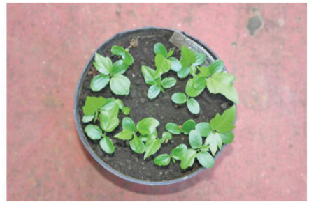
Fig. 3. Plantas híbridas de semillas del cruce de Passiflora vitifolia con P. ambigua (germinación 100%).