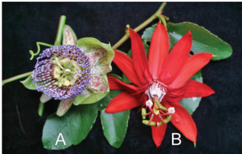
Fig. 4. A. Flor de Passiflora quadrangularis ; características asociadas con polinización por abejas solitarias y avispa (ej. Scoliidae). B. Flor de P. vitifolia ; características asociadas con polinización por colibríes.