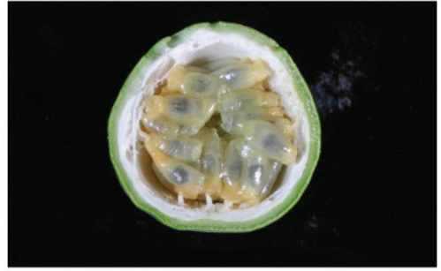
Fig. 2. Fruto de Passiflora vitifolia con semillas maduras del cruce con P. quadrangularis .