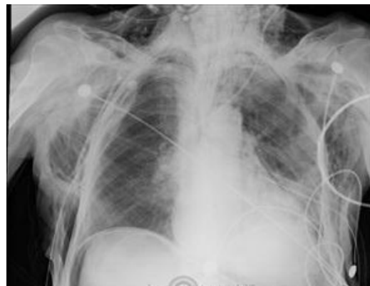
Figura No. 1. Neumomediastino, neumoperitoneo y enfisema subcutáneo posterior a la colocación de ambos sellos de tórax.

expandidos y había presencia de aire subdiafragmático (ver Figura No. 1).