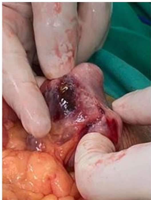
Figura No 2. Perforación colónica en el ciego.

paciente mostraba signos vitales normales, sin requerimiento de inotrópicos ni vasopresores, tampoco presentaba datos de shock, por lo que se elaboró una ileo-transverso anastomosis manual. Al ser las tres horas de posoperatorio, se extubó y se colocó una mascarilla con reservorio con oxígeno al 100 % por 24 horas como parte del protocolo de anastomosis. El primer día de posoperatorio inició con taquicardia supraventricular a repetición; por lo tanto, se le administró una infusión continua de amiodarona, y así mostró una adecuada respuesta terapéutica. Para el tercer día se retiró el sello de tórax izquierdo, además el paciente ya canalizaba gases y defecaba, por este motivo se inició la dieta. El quinto día presentó un cuadro de distensión abdominal y vómitos, por lo cual se le colocó una sonda nasogástrica con salida de material intestinal bilioso secundario a íleo parálítico. En el sexto día de posoperatorio, se retiró el sello de tórax derecho, y ya con peristalsis presente y sin distensión abdominal, se cerró la sonda nasogástrica. También, se reinició la dieta al octavo día con adecuada tolerancia. Durante el