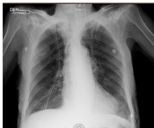
Figura No. 3. Radiografía del tórax previo al egreso del paciente.

internamiento, el paciente desarrolló una lesión renal aguda no oligúrica, alcanzando creatinina sérica de 2.38 mg/dl, la cual se resolvió de forma espontánea. En ningún momento se requirió soporte inotrópico. Cabe destacar que, antes del egreso, se realizó una radiografía de control, donde ya no se evidenciaba neumotórax, neumopericardio ni neumoperitoneo; sin embargo, aún mostraba un escaso enfisema subcutáneo (ver Figura No. 3).