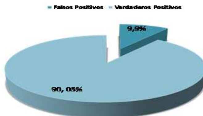
Figura 2. Valor promedio de verdaderos positivos y falsos positivos en hemocultivos DOBLES tomados de mayo a octubre de 2009 en el Hospital San Juan de Dios.