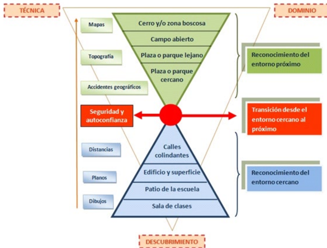
Figura 2. Progresión espacial para el trabajo de orientación en la escuela.

Este proceso de aprendizaje debe ser abordado desde un enfoque elemental hasta alcanzar un nivel avanzado. A partir de cada nivel de aprendizaje, se proponen las siguientes categorías para su aplicación: