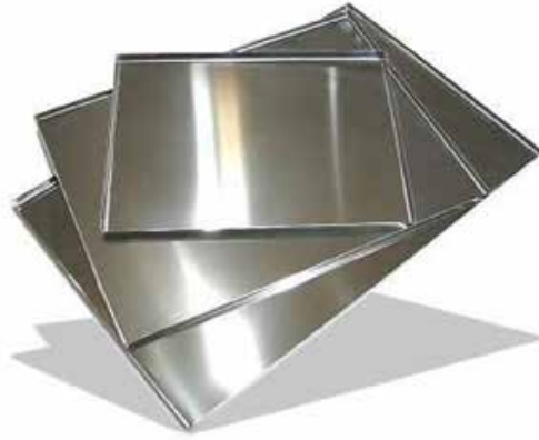
Figura 2. Placas de aluminio utilizadas para numerar los árboles del Bosque Demostrativo, San Ramón, Alajuela