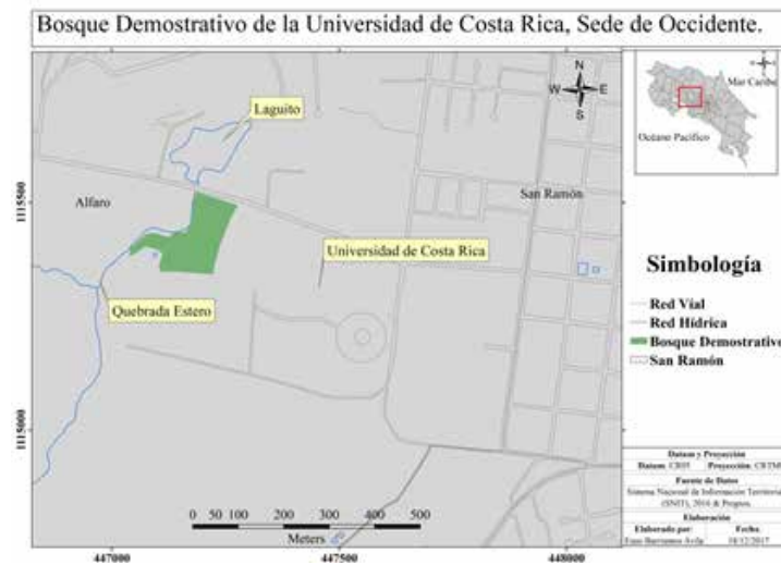
Figura 1. Croquis del área del Bosque Demostrativo de la Sede de Occidente, Alajuela, Costa Rica

La metodología consistió en identificar todos los árboles con un rango de DAP (diámetro a la altura del pecho) de 10 cm o mayor, para hacer un inventario florístico. Estos árboles fueron marcados con una lámina de aluminio de 5 cm de largo por 2,5 cm de ancho (Anexos, Figura 2),