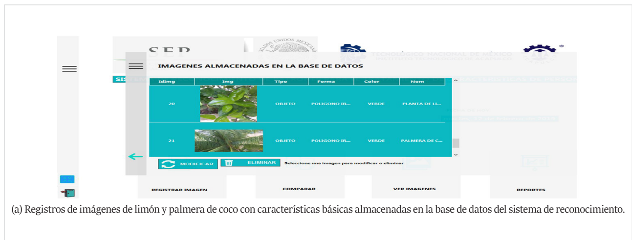
(a) Registros de imágenes de limón y palmera de coco con características básicas almacenadas en la base de datos del sistema de reconocimiento.

La Figura 6 presenta la sección de trabajo ver imágenes , que corresponde a visualizar los registros almacenados en la base de datos del sistema de reconocimiento y se contemplan también algunas de las operaciones básicas, como modificar la información y eliminar registros de la BD.