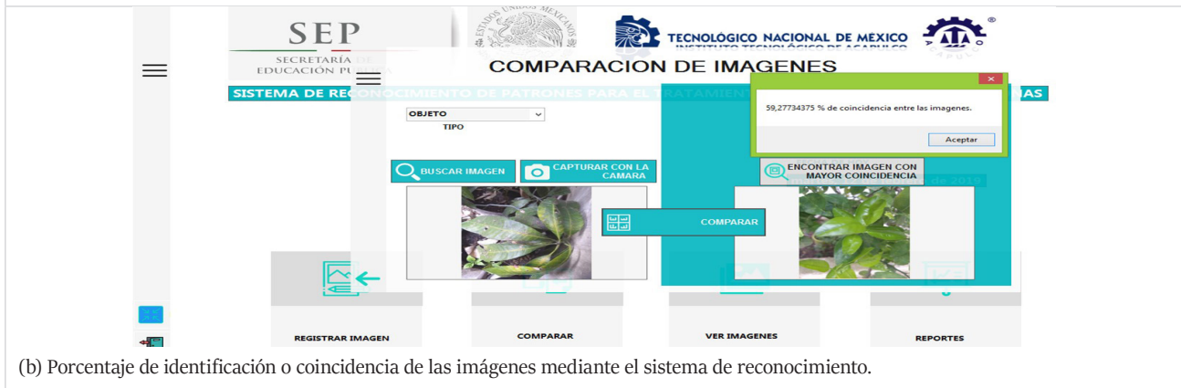
(b) Porcentaje de identificación o coincidencia de las imágenes mediante el sistema de reconocimiento.