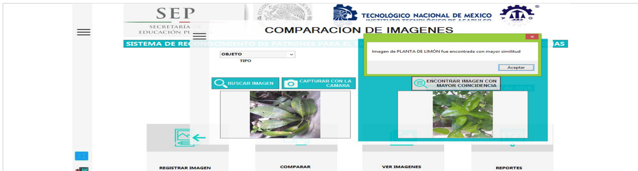
(a) Similitud de coincidencia entre las imágenes, mediante el sistema de reconocimiento.

el tamaño de la imagen y prioridad de almacenamiento en la Base de Datos, contempló la mayor coincidencia y consideró que ambas plantas guardaban cierta similitud. En la siguiente transacción de la ejecución del sistema de reconocimiento se realizó la comparación de las mismas imágenes de plantas, y al realizar el procesamiento, se generó como resultado un 59.27% de coincidencia entre las imágenes.