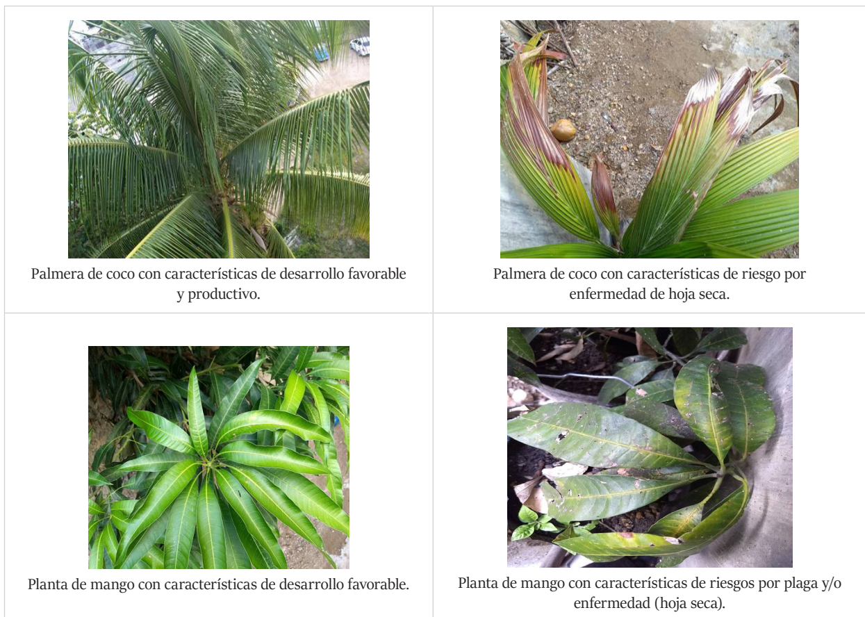
Figura 3. Plantas endémicas (palmeras de coco y el mango con diferentes estados) de Acapulco y la Costa Chica del estado de Guerrero, México. Análisis de campo y pruebas de sistema, 2018.

En la Figura 3 se señalan imágenes de los cultivos de palmera de coco y el mango, que fueron capturadas con el dron durante el trabajo de campo y almacenadas posteriormente en la Base de Datos del sistema de reconocimiento automático de patrones y características; y en las que se identifican la forma de la planta, el color, el contorno, la densidad, el riesgo, entre otras características consideradas para realizar la comparación.