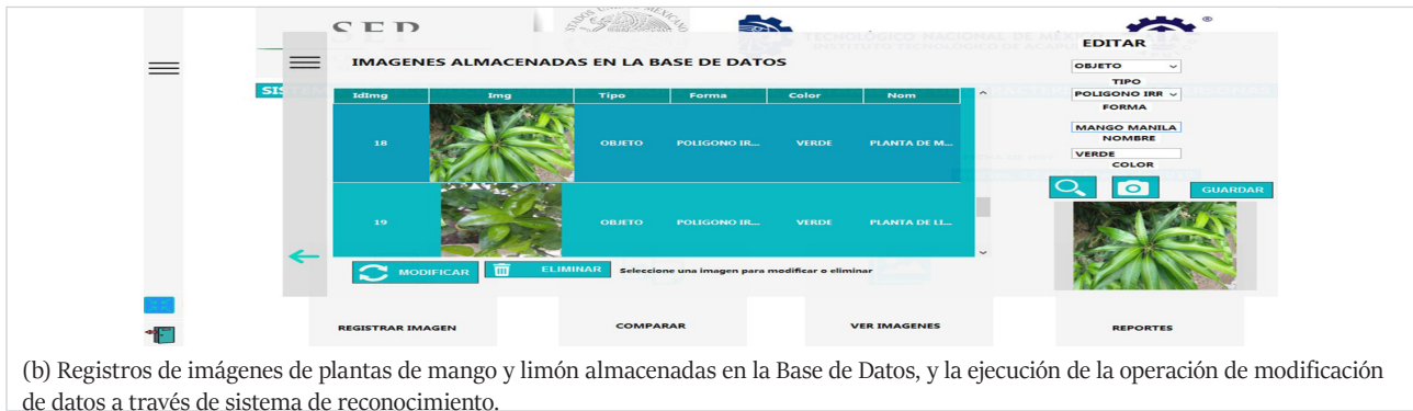
(b) Registros de imágenes de plantas de mango y limón almacenadas en la Base de Datos, y la ejecución de la operación de modificación de datos a través de sistema de reconocimiento.