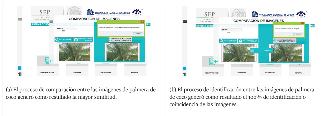
Figura 8. Pruebas de desempeño a través de la plataforma de trabajo del sistema de reconocimiento automático de patrones y características de las imágenes de los cultivos como alternativa de desarrollo agrícola.

comparación de una imagen perteneciente a una palmera de coco, y al realizar el procesamiento de búsqueda en la base de datos encontró una imagen que tenía las mismas características, reconociendo una mayor similitud y coincidencia del 100% entre las imágenes con desarrollo favorable (Figura 8).