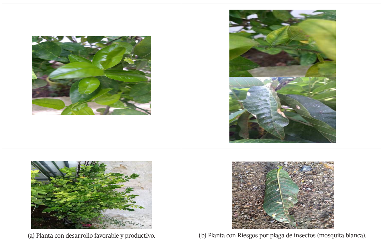
Figura 4. Plantas endémicas (limón) de Acapulco y la Costa Chica del estado de Guerrero, México, Análisis de campo y pruebas de sistema, 2018.

En la Figura 4 se señalan las imágenes almacenadas en la base de datos, las cuales fueron utilizadas en las pruebas preliminares para el procesamiento y selección de características mediante algoritmos de reconocimiento de patrones.