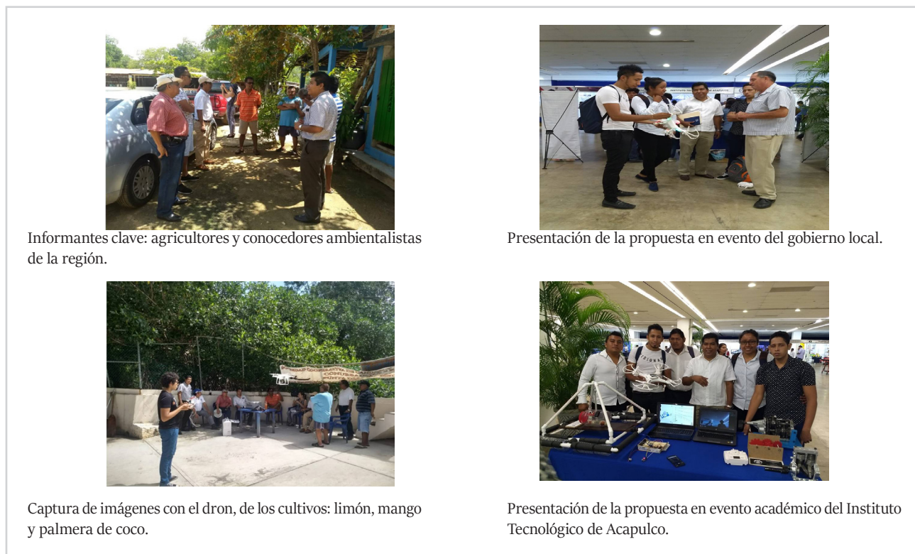
Figura 2. Trabajo de campo, se aplican entrevistas de opinión a los informantes clave; y se realiza la captura de las imágenes tomadas con el dron de las plantas de limón, el mango y la palmera de coco cultivadas en la costa de Acapulco, Gro., México.

El proceso de reconocimiento automático de las imágenes que son identificadas con características de desarrollo óptimo y favorable, y características con desarrollo no favorable por riesgo de plaga o enfermedad del cultivo, considera una serie de actividades que comienzan con el control de vuelo del dron, con la captura de las imágenes, el sistema de reconocimiento y el análisis de la información. El control de vuelo del dron se inicia con el análisis y especificaciones de funcionalidad de los componentes, en los que se contempla el tipo de cámara, las aplicaciones de software , el tiempo o duración de carga de la batería, la distancia, el control a través del dispositivo móvil, entre otras funcionalidades, y por supuesto, el manejo de este recurso electrónico.