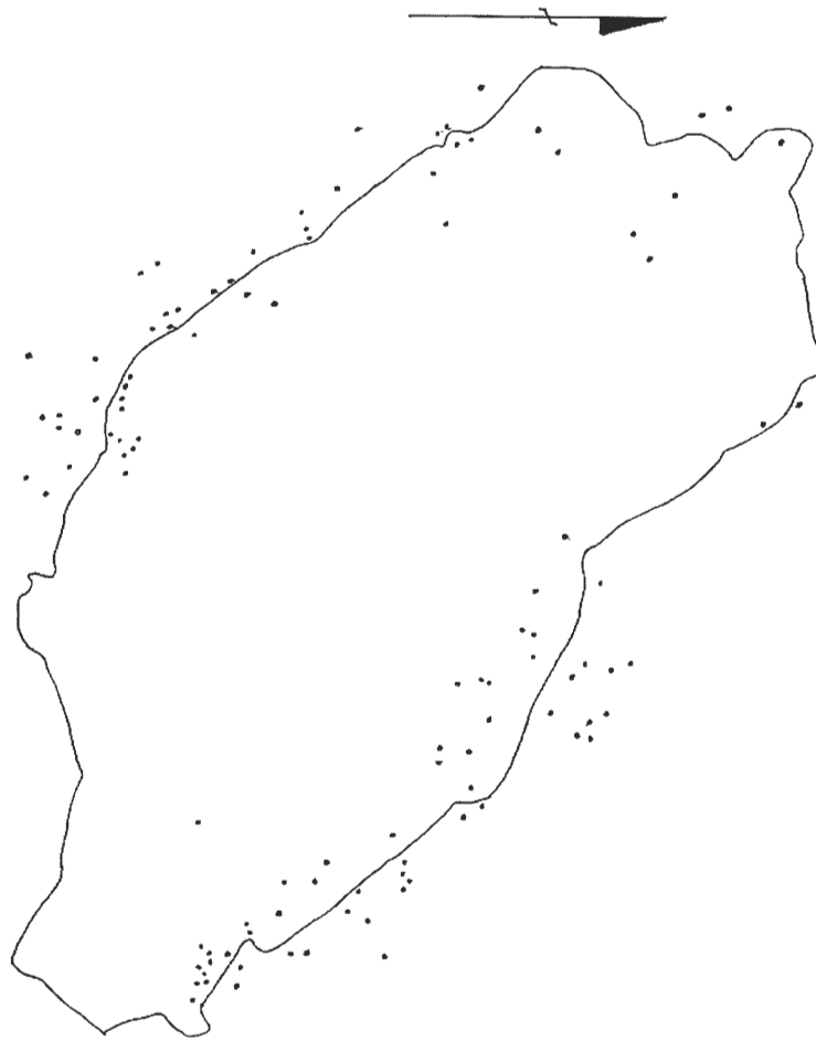
Figura 1: Distribución espacial de Iriartea deltooides en la zona de estudio de la Reserva Biológica Alberto Manuel Brenes, San Ramón, Costa Rica, 1988.