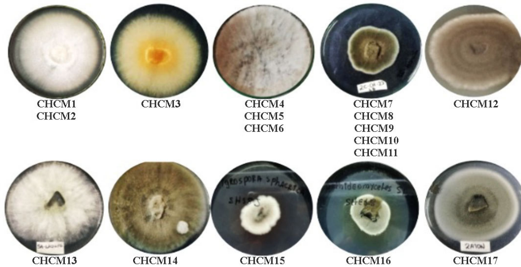
Figura 3. Aislamientos fúngicos de plantas de Musa acuminata con manchas foliares. Pampas de Hospital, Tumbes, Perú. Mayo de 2019.

Figure 3. Fungal isolates from Musa acuminata plants with leaf spots. Pampas de Hospital, Tumbes, Peru. May 2019.