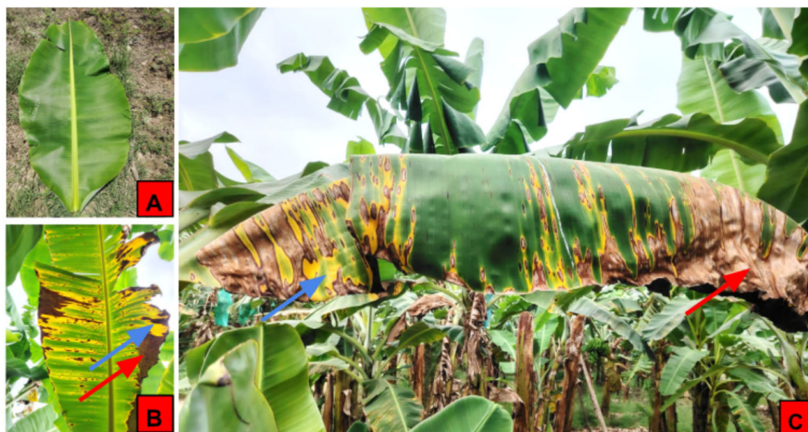
Figura 2. Planta de Musa acuminata de la localidad de Pampas de Hospital con manifestación y sin manifestación de manchas foliares. A) Vista del envés de una hoja sin manchas. B) Vista del haz de una hoja con manchas. C) Vista lateral del haz de una hoja con manchas. Tumbes, Perú. Mayo de 2019.

Flechas rojas señalan manchas marrones, y flechas azules, manchas amarillas.