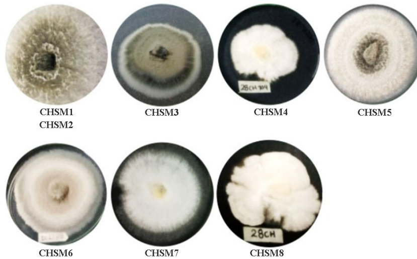
Figura 4. Aislamientos fúngicos de plantas de Musa acuminata sin manchas foliares. Pampas de Hospital, Tumbes, Perú. Mayo de 2019.

Figure 3. Fungal isolates from Musa acuminata plants with leaf spots. Pampas de Hospital, Tumbes, Peru. May 2019.