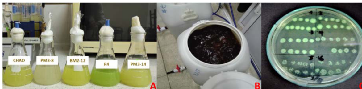
Figura 1. Proceso de multiplicación celular de las rizobacterias en formulaciones líquidas. A) Crecimiento del preinóculo bacteriano. B) Fermentación de las bacterias en tanques de 50 L. C) Concentración celular 24 horas después del análisis microbiológico. Quevedo, Ecuador, 2020.

Figure 1. Process of cell multiplication of the rhizobacteria in liquid formulations. A) Growth of the bacterial pre-inoculum. B) Cell development in 50 L fermenters. C) Cell concentration 24 hours after microbiological analysis. Quevedo, Ecuador, 2020.