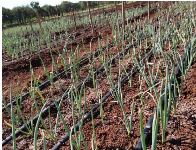
Figura 5. Secado de las puntas de cebolla ( Allium cepa L.), causados por Caliothrips phaseoli , en la localidad de El Ejido, provincia de Los Santos. Instituto de Innovación Agropecuaria de Panamá. 2020-2021.