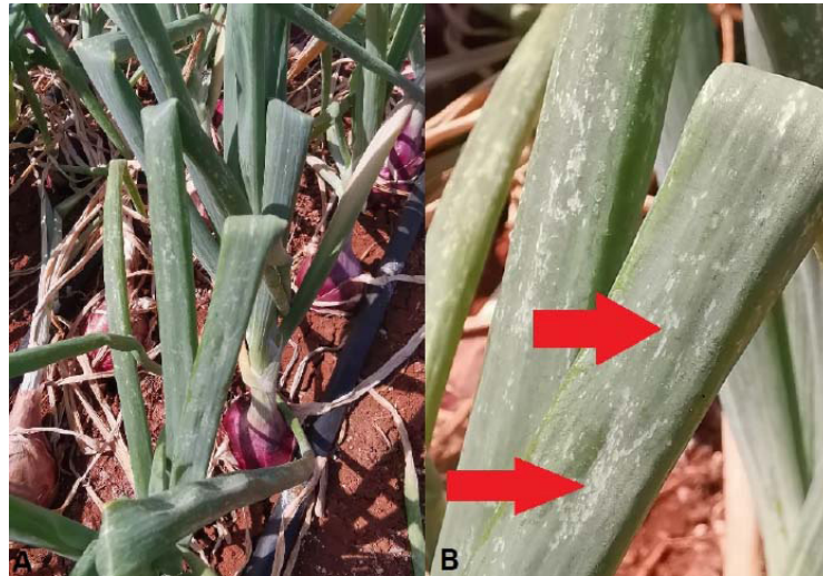
Figura 4. Daños causados por Caliothrips phaseoli en hojas de cebolla ( Allium cepa L.) (A) Síntomas de decoloración en el haz de una hoja; (B) Decoloración y manchas blancas en el envés de una hoja. Instituto de Innovación Agropecuaria de Panamá. 2020-2021.