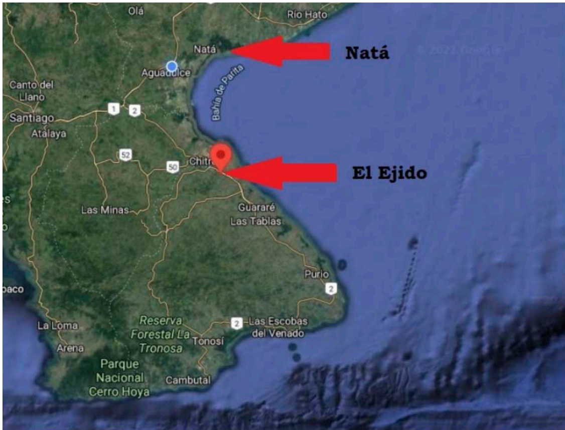
Figura 1. Localización geográfica del área de muestreo. Localidades de Natá y El Ejido en Panamá. Instituto de Innovación Agropecuaria de Panamá. 2020-2021.