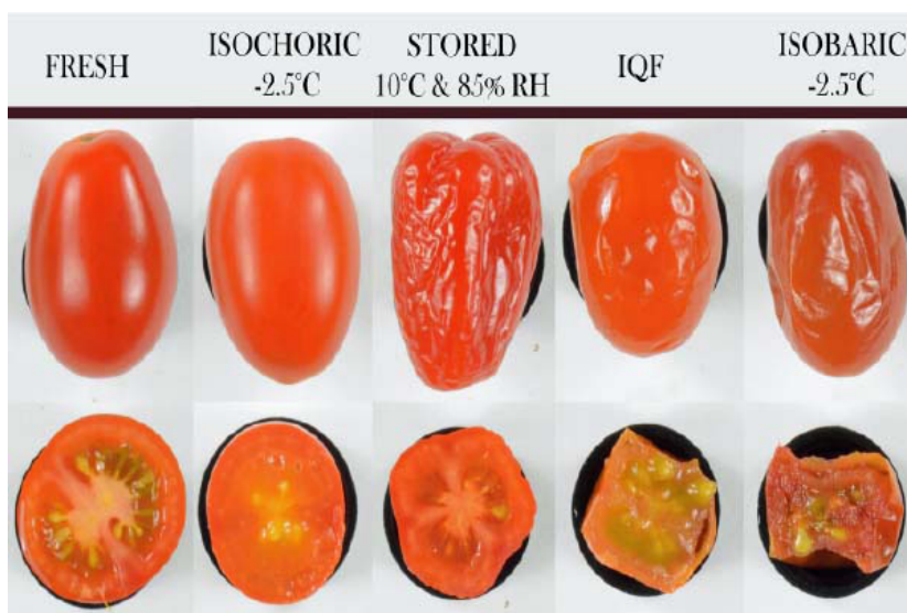
Figura 3. Tomates bajo diferentes procesos de congelación (Bilbao-Sainz et al., 2021).

Los cambios mayores en las propiedades de textura de los tomates fueron relacionados con los procesos isobáricos e IQF. En los cuales se obtuvieron tomates con escasa fuerza de fractura y una gran pérdida de elasticidad. Estos efectos son causados por la desintegración de las membranas, daños en los tejidos, actividad enzimática, recristalización y probables ciclos de descongelación-congelación. Lo anterior se representa de forma visual en la Figura 3 (Bilbao-Sainz et al., 2021).