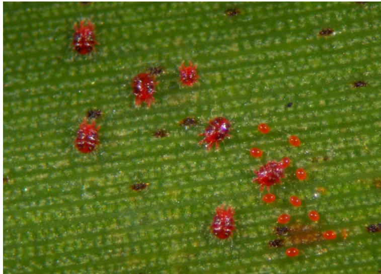
Figura 2. Colonia de Raoiella indica Hirst (Acari: Tenuipalpidae) en Palma de seje Oenocarpus bataua . Se observan once huevos, una ninfa y seis adultos del ácaro. Villavicencio, Meta, Colombia. 2019.

Figure 2. The Raoiella indica Hirst (Acari: Tenuipalpidae) colony in seje Palm Oenocarpus bataua . Eleven eggs, a nymph and six adults of the mite are observed. Villavicencio, Meta, Colombia. 2019.