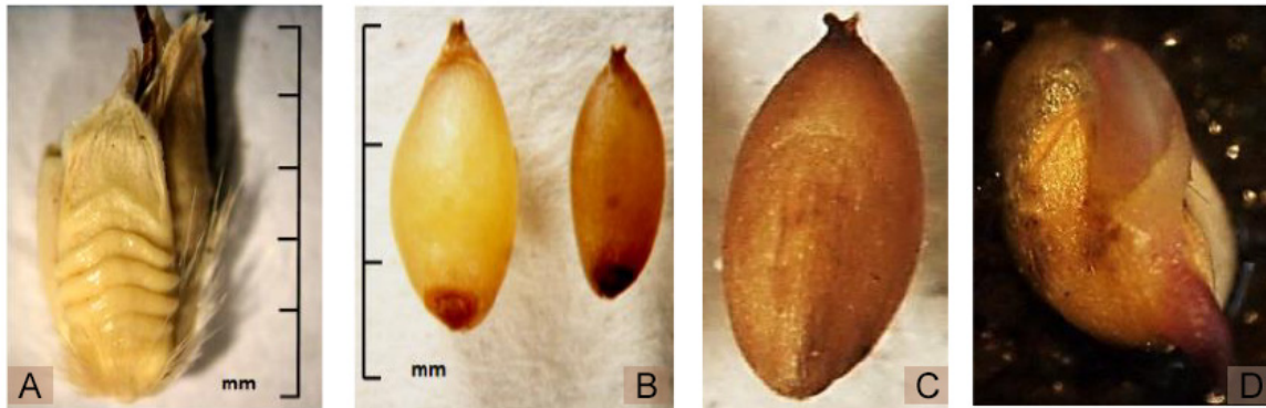
Figura 1. Unidad de dispersión de I. rugosum Salisb. 40x. A) Espiguilla, B) dos diferentes cariopsis ubicadas en cada unidad de dispersión, una grande y otra pequeña, C) cariopsis parte dorsal, D) inicio de emergencia de radícula. Laboratorio Oficial de Análisis de Calidad de Semillas del Centro para Investigaciones en Granos y Semillas (CIGRAS) de la Universidad de Costa Rica. San José, Costa Rica, 2015.

en la parte inferior que corresponde a una fracción de la base, la cual es una sección que se encuentra endurecida. Para realizar el corte se empleó un bisturí de laboratorio.