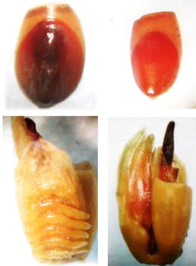
Figura 3. Coloración de las unidades propagativas de I. rugosum Salisb. después de ser sometidas a la prueba de tetrazolio almacenadas a temperatura ambiente, embebidas y con corte. A) Cariópside grande (40 x), B) cariópside pequeña (40 x), C) parte ventral de la espiguilla (30x), D) parte dorsal de la espiguilla (30x). Laboratorio Oficial de Análisis de Calidad de Semillas del Centro para Investigaciones en Granos y Semillas (CIGRAS) de la Universidad de Costa Rica. San José, Costa Rica, 2015.

Figure 3. Staining of the propagating units of I. rugosum Salisb. after being tetrazolium tested and stored at room temperature, embedded, and cut pretreated at room temperature during storage, embedded. A) Large caryopsis (40 x), B) small caryopsis (40 x), C) ventral part of the spikelet (30x), D) dorsal part of the spikelet (30x). Laboratorio Oficial de Análisis de Calidad de Semillas del Centro para Investigaciones en Granos y Semillas (CIGRAS) de la Universidad de Costa Rica. San José, Costa Rica, 2015.