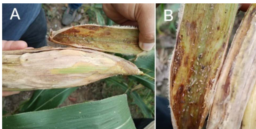
Figura 3. A. Presencia de Peregrinus maidis en la vaina de la mazorca de maíz. B. Daño causado por adultos y ninfas de P. maidis agrupados en el interior de la vaina de la mazorca de maíz. Península de Azuero, Panamá. 2024.

Se observaron daños directos causados por los adultos en el interior de la vaina de la mazorca de maíz. Estos se manifestaron en forma de manchas marrones y zonas necrosadas, con presencia de secreciones (Figura 3). Adicionalmente, se registraron daños indirectos asociados a la presencia de fumagina, originada por la excreción de líquido azucarado producido por los adultos. Esta fumagina provocó la aparición de manchas marrones distribuidas sobre la superficie externa de la vaina.