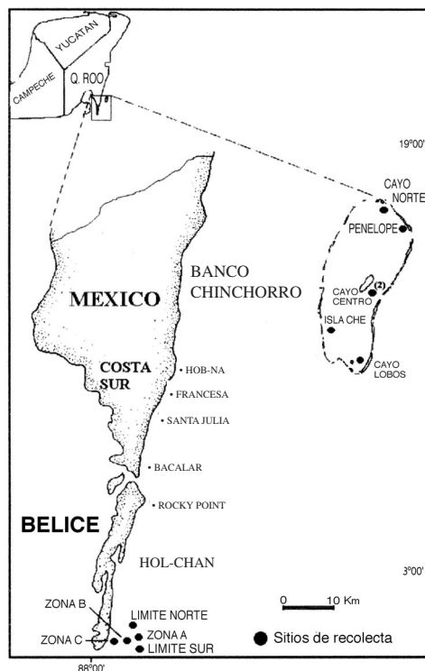
Fig. 1. Ubicación del área de estudio y de los sitios de recolecta.

Las recolectas se realizaron en México en la costa sur (CS) en cuatro sitios y Banco Chinchorro (BCH) en seis sitios. En Belice las muestras se recolectaron en la Reserva Marina de Hol-Chan (HCH) en seis sitios (Fig.1).