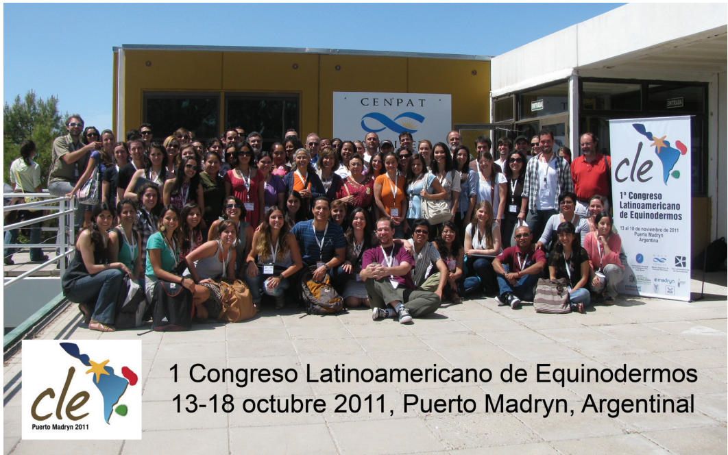
1 Congreso Latinoamericano de Equinodermos 13-18 octubre 2011, Puerto Madryn, Argentina

Grupo de participantes del 1 er Congreso Latinoamericano de Equinodermos/ Group of participants of the 1 st Latin American Echinoderm Congress.