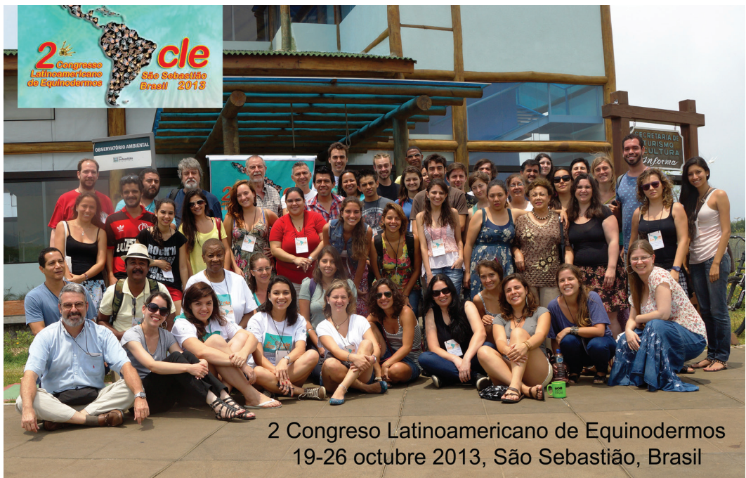
2 Congreso Latinoamericano de Equinodermos 19-26 octubre 2013, São Sebastião, Brasil

Grupo de participantes del 1 er Congreso Latinoamericano de Equinodermos/ Group of participants of the 1 st Latin American Echinoderm Congress.