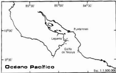
Fig. 1. Localización y ubicación en el Golfo de Nicoya de Mytella strigata . Mapa Escolar de Costa Rica. MOPT, Instituto Geográfico Nacional, 1984.

5455 mejillones/m 2 , estimándose la población total en 61,1 millones de individuos. En la playa se observó espacios construidos por las rayas. La raya gabilana ( Myliobatidae ) es la más frecuente. Esto sugiere que Lepanto es área de descanso y de alimentación para estos rajiformes. Escasas evidencias indican que estas rayas consumen M. strigata , y que excretan la concha intacta, reluciente y agrupadas en los espacios citados. Esto será aclarado cuando se realice un análisis del contenido en el tracto digestivo de las rayas.