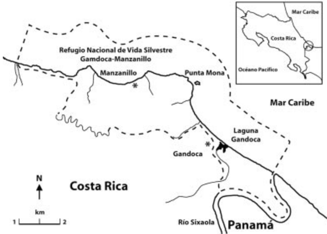
Fig. 1. Refugio Nacional de Vida Silvestre Gandoca-Manzanillo, Limón, Costa Rica. Modificado de MIRENEM-UICN/ORMA (1994). - - - Límite del Refugio.

principal de las familias gandoqueñas es la agricultura y ganadería de subsistencia, pero la mitad de la población tiene como principal fuente de ingresos el trabajo en las fincas bananeras del Valle Sixaola (Coll 2000). En este valle se asientan las mayores extensiones de fincas bananeras de la región del Caribe de Costa Rica, siendo el cultivo de banano, de carácter intensivo, una de las actividades económicas más importantes de la provincia de Limón.