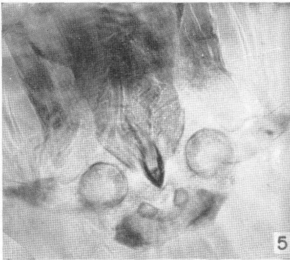
5 Aparato espiracular. 200 X

Indicamos que la llave implica un sistema de análisis idéntico para cada larva pues de lo contrario no se ajustará a los números asignados.