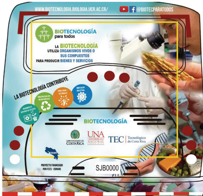
Fig 3. Campaña de información y divulgación del proyecto en la parte trasera de los buses de la ruta de La Periférica en San José.

Finalmente, se llevó a cabo el primer taller de introducción a la ingeniería genética en plantas cuyo objetivo general fue brindar conocimientos teóricos y aplicados del uso de la ingeniería genética para ámbitos de investigación y de aplicación para mejora genética de cultivos. En dicho curso se contó